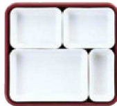
8 仕切Eセット (2×1・3×2・6×1)