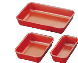
12 TA C-7-C-6 アクティブ弁当用仕切 朱