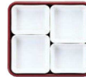
10 仕切Mセット (3×2・4×2)