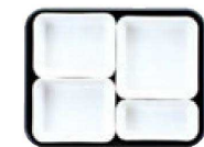
18 仕切Tセット 2×1・3×2・4×1