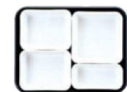
18 仕切Tセット 2×1・3×2・4×1