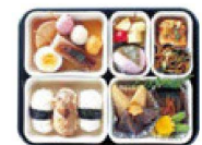
17 仕切Qセット 9×2・3×3