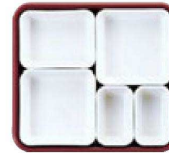
9 仕切Lセット (1×2・3×1・4×2)