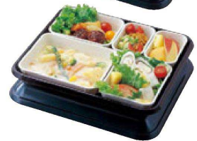
3 F-4-62 MT C-7 アクティブ弁当 ワイン内黒