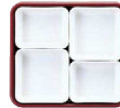
10 仕切Mセット (3×2・4×2)