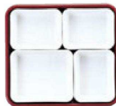
6 仕切Bセット (3×3・6×1)