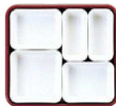
5 仕切Aセット (2×2・3×2・4×1)