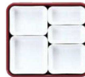
7 仕切Dセット (2×2・3×2・4×1)