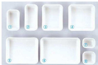
1 P.P.C-7-C-6 アクティブ弁当用仕切 白

¥3,200 (外寸:68×40×13.5・内寸:63.7×36.3×12.4) 梱10