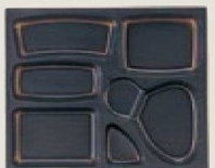
⑲ 1-451-12 P.S.W-7 尺3寸長手 P.S 黒仕切 1ヶ¥125 梱700