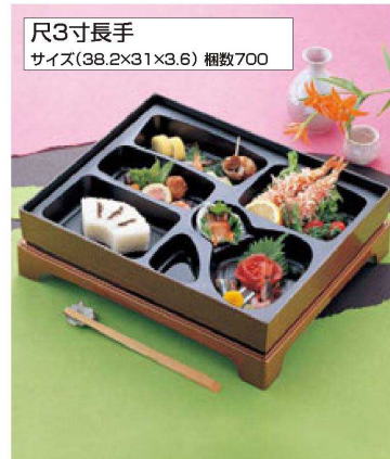
尺3寸長手 サイズ(38.2×31×3.6) 梱数700