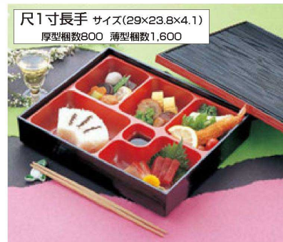
尺1寸長手 サイズ(29×23.8×4.1) 厚型梱数800 薄型梱数1,600