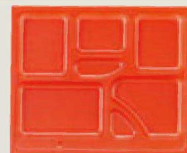
⑬ 1-451-8 P.S.W-6 尺2寸長手 P.S朱仕切 1ヶ¥110 梱800