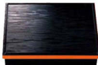
⑨ 1-240-5 A尺1寸長手ヘギ目松花堂 黒測朱(仕切別) ¥2,600 (31.3×26×6.8) 梱20