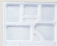
⑭ F-2-68 P.S.W-6 尺2寸長手 P.S白仕切 1ヶ¥110 梱800