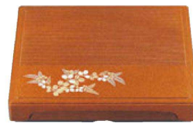
⑳ 1-346-2 A尺3寸千筋箱膳 梨地萩(仕切別) ¥6,100 (40×33×6.7) 梱10