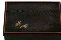
⑫ 1-367-1 A新尺1寸長手松花堂 黒天朱笹(仕切別) ¥3,300 (31.3×26×6.8) 梱20