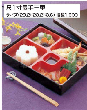
尺1寸長手三里 サイズ(29.2×23.2×3.6) 梱数1,600