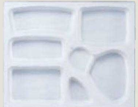
⑱ F-2-75 P.S.W-7 尺3寸長手 P.S白仕切 1ヶ¥125 梱700