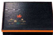
⑩ 1-240-6 A尺1寸長手木目松花堂 黒測朱春秋(仕切別) ¥3,400 (31.5×26×7) 梱20