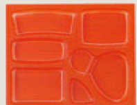
⑰ 1-451-11 P.S.W-7 尺3寸長手 P.S朱仕切 1ヶ¥125 梱700