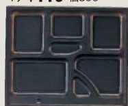
⑮ 1-451-9 P.S.W-6 尺2寸長手 P.S黒仕切 1ヶ¥110 梱800