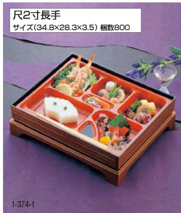
尺2寸長手 サイズ(34.8×28.3×3.5) 梱数800