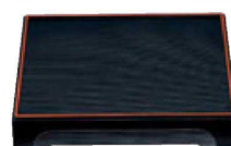
⑪ 1-241-6 A尺1寸長手御膳千筋松花堂 黒天朱(仕切別) ¥3,300 (31.3×26×7) 梱20