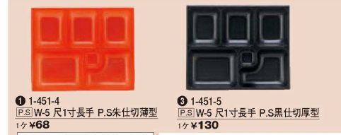
① 1-451-4 P.S.W-5 尺1寸長手 P.S朱仕切薄型 1ヶ ¥68

衛生的・省力化・経済的です。(P.S仕切とボックスは、カートン単位でお求め下さい。)