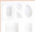
㉑ P.S.W-2 8寸角 1-450-6 P.S白ひょうたん仕切薄型 1ヶ ¥44