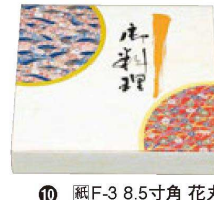
⑩ 紙F-3 8.5寸角 花丸 1-454-10 1ヶ ¥380 (24.2×24×4.4) 梱200