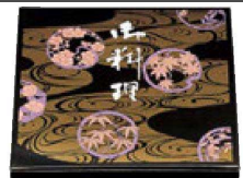
㉔ 紙F-2 8寸角 光琳 1-455-14 1ヶ ¥330 (23.2×23×4) 梱300