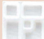
⑲ P.S.W-1 8寸角 1-450-10 P.S白仕切薄型 1ヶ ¥44