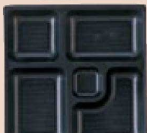
⑱ P.S.W-1 8寸角 1-450-4 P.S黒仕切薄型 1ヶ ¥44