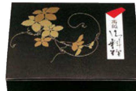
⑤ 紙F-4 尺1寸長手 金平目蒿 1-454-3 1ヶ ¥390 (30×24×4.4) 梱200