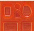
⑳ P.S.W-2 8寸角 1-450-7 P.S朱ひょうたん仕切薄型 1ヶ ¥44