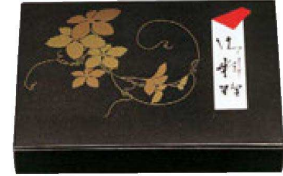
⑰ 紙F-1 9寸長手 金平目蒿 1-455-7 1ヶ ¥350 (26.2×19.8×4) 梱300