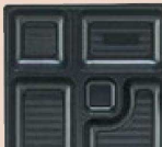
㉒ P.S.W-1 8寸角 1-450-11 P.S黒仕切厚型 1ヶ ¥100