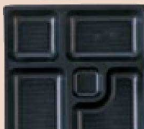
⑱ P.S.W-1 8寸角 1-450-4 P.S黒仕切薄型 1ヶ ¥44