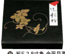
㉕ 紙F-2 8寸角 金平目蒿 1-455-15 1ヶ ¥330 (23.2×23×4) 梱300