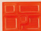
⑬ P.S.W-3 9寸長手 1-450-17 P.S朱仕切薄型 1ヶ ¥44