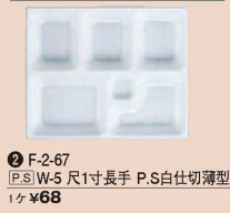
③ F-2-67 P.S.W-5 尺1寸長手 P.S白仕切薄型 1ヶ ¥68