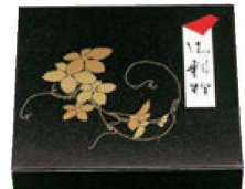
⑪ 紙F-3 8.5寸角 金平目蒿 1-454-11 1ヶ ¥380 (24.2×24×4.4) 梱200