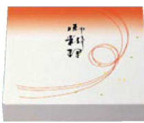
⑨ 紙F-3 8.5寸角 結び 1-454-9 1ヶ ¥380 (24.2×24×4.4) 梱200