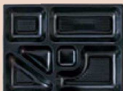
⑮ P.S.W-3B 9寸長手 1-450-19 P.SB黒仕切薄型 1ヶ ¥44