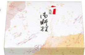
④ 紙F-4 尺1寸長手 和歌 1-454-4 1ヶ ¥390 (30×24×4.4) 梱200