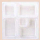
⑦ 1-450-13 P.S.W-4 8.5寸角 P.S白仕切薄型 1ヶ ¥43