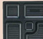
㉓ P.S.W-1 8寸角 1-450-11 P.S黒仕切厚型 1ヶ ¥100