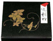
㉔ 紙F-2 8寸角 金平目蒿 1-455-15 1ヶ ¥330 (23.2×23×4) 梱300