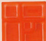
⑲ P.S.W-1 8寸角 1-450-5 P.S朱仕切薄型 1ヶ ¥44