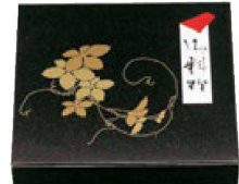
⑪ 紙F-3 8.5寸角 金平目蒿 1-454-11 1ヶ ¥380 (24.2×24×4.4) 梱200