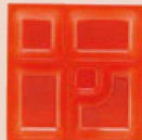
⑥ 1-450-12 P.S.W-4 8.5寸角 P.S朱仕切薄型 1ヶ ¥43