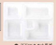
⑫ P.S.W-3 9寸長手 1-450-18 P.S白仕切薄型 1ヶ ¥44