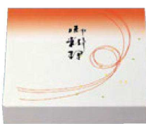
⑨ 紙F-3 8.5寸角 結び 1-454-9 1ヶ ¥380 (24.2×24×4.4) 梱200