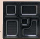
⑧ 1-450-14 P.S.W-4 8.5寸角 P.S黒仕切厚型 1ヶ ¥105