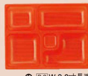
⑬ P.S.W-3 9寸長手 1-450-17 P.S朱仕切薄型 1ヶ ¥44