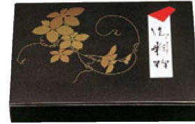
⑰ 紙F-1 9寸長手 金平目蒿 1-455-7 1ヶ ¥350 (26.2×19.8×4) 梱300