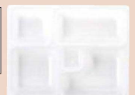
⑫ P.S.W-3 9寸長手 1-450-18 P.S白仕切薄型 1ヶ ¥44