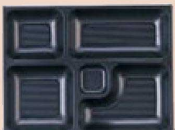
⑭ P.S.W-3 9寸長手 1-450-20 P.S黒仕切厚型 1ヶ ¥108