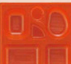
㉑ P.S.W-2 8寸角 1-450-7 P.S朱ひょうたん仕切薄型 1ヶ ¥44