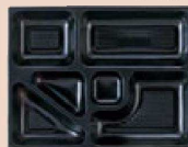
⑮ P.S.W-3B 9寸長手 1-450-19 P.SB黒仕切薄型 1ヶ ¥44