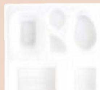
㉒ P.S.W-2 8寸角 1-450-6 P.S白ひょうたん仕切薄型 1ヶ ¥44