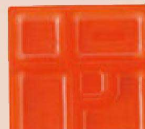
⑲ P.S.W-1 8寸角 1-450-5 P.S朱仕切薄型 1ヶ ¥44