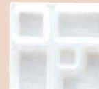
⑳ P.S.W-1 8寸角 1-450-10 P.S白仕切薄型 1ヶ ¥44