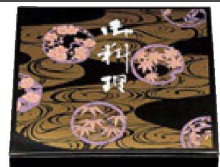
㉓ 紙F-2 8寸角 光琳 1-455-14 1ヶ ¥330 (23.2×23×4) 梱300