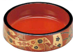
⑮ A D.X6寸桶 朱に結び内朱 1-467-6 ¥1,200 (18φ×5.5・内寸16.2φ×4.2) 梱60