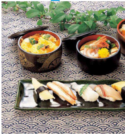
D.X4 寸タイコ桶は、浅型と深型があります。