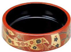
⑯ A D.X6寸桶 朱に結び内黒 1-467-7 ¥1,200 (18φ×5.5・内寸16.2φ×4.2) 梱60