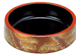
⑰ A D.X6寸桶 梨地赤松内黒 1-467-8 ¥1,200 (18φ×5.5・内寸16.2φ×4.2) 梱60