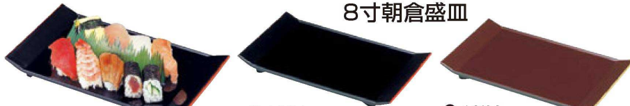
写真は9寸朝倉盛皿 黒洩朱 を使用しております。