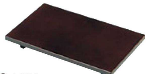
⑦ 1-499-6 [A] D.X9寸盛台 溜底黒塗 S-S塗 ¥4,800 (27.5×16.8×4) 幅40