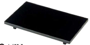
⑥ 1-499-5 [A] D.X9寸盛台 黒漆調塗 ¥3,300 (27.5×16.8×4) 幅40