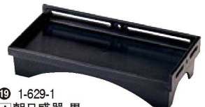
⑩ 1-629-1 [A] 朝日盛器 黒 ¥2,500 (26×12.5×5.5) 幅60