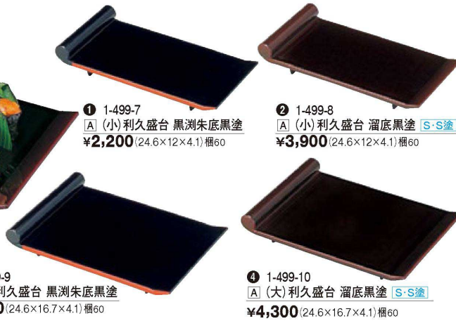
① 1-499-7 [A] (小) 利久盛台 黒洩朱底黒塗 ¥2,200 (24.6×12×4.1) 幅60