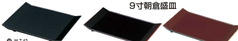
⑭ M-7-42 [A] (大) 9寸朝倉皿足付 黒(全面塗) ¥2,950 (27.2×21.3×3) 幅60