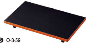
⑤ O-3-59 [A] D.X9寸盛台 黒洩朱 ¥2,200 (27.5×16.8×4) 幅40