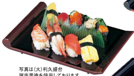
写真は(大)利久盛台 溜底黒塗を使用しております。