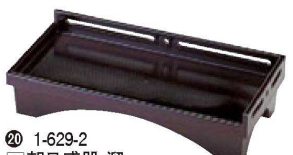
⑪ 1-629-2 [A] 朝日盛器 溜 ¥2,900 (26×12.5×5.5) 幅60