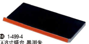
⑨ 1-499-4 [A] 8寸盛台 黒洩朱 ¥2,100 (23×12.5×3) 幅50