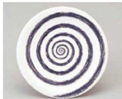
㉑ 1-503-19 TA 寿司皿 九頭竜 ¥650