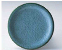
⑧ O-4-44 TA 寿司皿 アクアグリーン測塗 ¥600