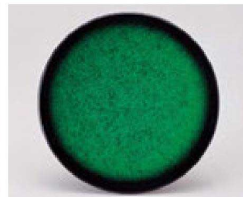
㉕ 1-505-10 TA 寿司皿 アクアグリーン ¥770