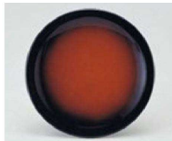
③ 1-503-1 TA 寿司皿 曙 ¥620