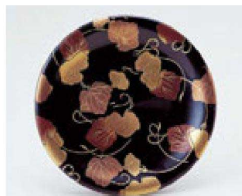
㉘ O-70-13 TA 寿司皿 黒に二色ツタ ¥1,030