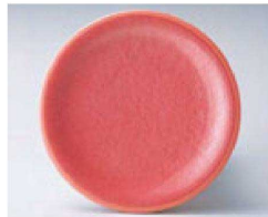
⑨ O-4-45 TA 寿司皿 アクアピンク測塗 ¥600