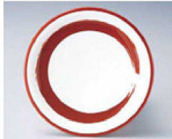
⑫ O-4-36 TA 寿司皿 朱一筆 ¥640