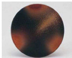
㉖ 1-505-13 TA 寿司皿 茶しぶぎ ¥930