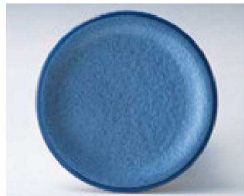
⑥ O-4-41 TA 寿司皿 アクアブルー測塗 ¥600