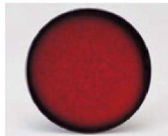
㉔ 1-505-9 TA 寿司皿 アクアレッド ¥770