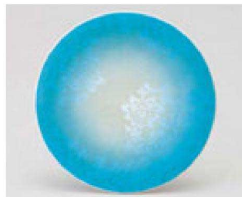
㉓ 1-503-12 TA 寿司皿 ブルー彩華 ¥720