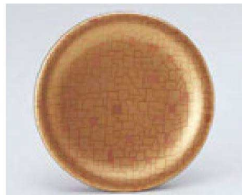
⑱ O-70-18 TA 寿司皿 金石目 ¥900