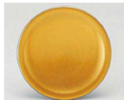
㉚ 1-505-3 TA 寿司皿 金雅 ¥1,150