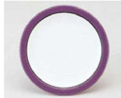
⑮ 1-503-18 TA 寿司皿 パープルライン ¥700