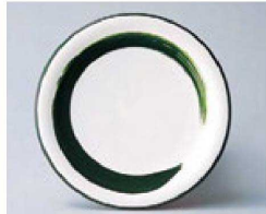
⑪ O-4-35 TA 寿司皿 グリーン一筆 ¥640