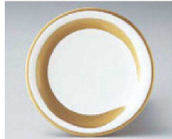
⑭ O-4-38 TA 寿司皿 金一筆 ¥640