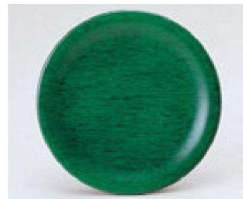
⑤ O-70-11 TA 寿司皿 グリーン木目 ¥650