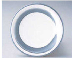
⑬ O-4-37 TA 寿司皿 シルバー一筆 ¥640