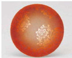
㉒ 1-503-11 TA 寿司皿 ブラウン彩華 ¥720