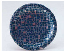
⑯ O-70-15 TA 寿司皿 紺に銀石目 ¥720