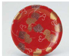
㉙ O-70-14 TA 寿司皿 朱に二色ツタ ¥1,150