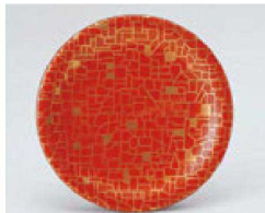
⑰ O-70-16 TA 寿司皿 朱に金石目 ¥720