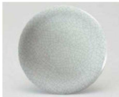
② O-8-43 TA 寿司皿 石目 ¥550