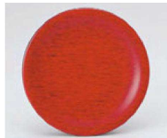
④ O-70-10 TA 寿司皿 レッド木目 ¥650