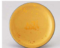
⑳ 1-505-16 TA 寿司皿 色紙金箔 ¥1,070