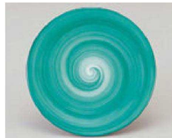
⑲ 1-503-20 TA 寿司皿 清流 ¥900