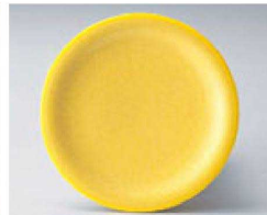
⑩ O-4-46 TA 寿司皿 アクアイエロー測塗 ¥600