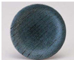
㉗ 1-505-14 TA 寿司皿 銀糸 ¥970