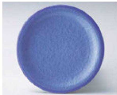
⑦ O-4-43 TA 寿司皿 アクアパープル測塗 ¥600