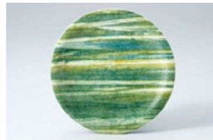
③ O-7-16 M 寿司皿 緑柳染 ¥1,100