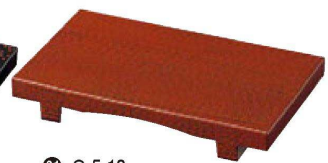
㉑ O-5-18 A ABS寿司ゲタ 溜刷毛目 ¥1,200 (14.9×9×2.2)