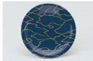
⑪ 1-509-18 M 寿司皿 西陣紺の河 ¥1,600