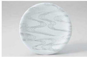
⑤ O-7-18 M 寿司皿 西陣銀流水 ¥1,600