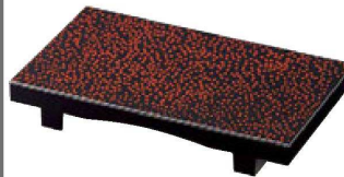
⑳ O-5-17 A ABS寿司ゲタ 黒姫子 ¥1,150 (14.9×9×2.2)