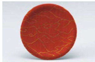
⑩ O-1-92 M 寿司皿 西陣朱の河 ¥1,600