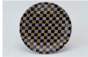
⑮ 1-509-20 M 寿司皿 西陣金銀市松 ¥1,650