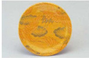
⑬ 1-509-14 M 寿司皿 西陣金の鶴 ¥1,600