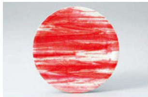
① O-7-13 M 寿司皿 赤柳染 ¥1,100