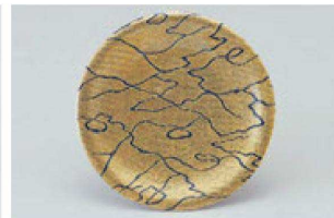
⑫ 1-509-19 M 寿司皿 西陣金の河 ¥1,600