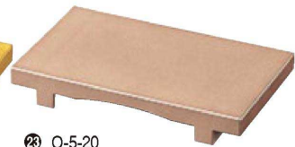
㉓ O-5-20 A ABS寿司ゲタ 金煌塗 ¥1,800 (14.9×9×2.2)