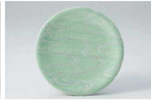
⑧ O-7-22 M 寿司皿 西陣緑流水 ¥1,600