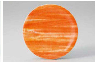
④ O-7-17 M 寿司皿 橙柳染 ¥1,100