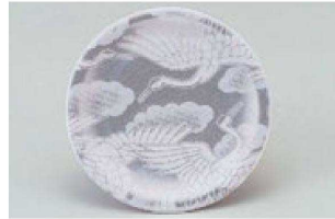
⑭ 1-509-15 M 寿司皿 西陣銀の鶴 ¥1,600