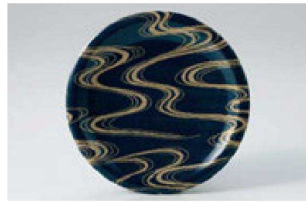
⑥ O-7-19 M 寿司皿 西陣紺流水 ¥1,600