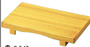
㉒ O-5-19 A ABS寿司ゲタ 白木塗 ¥1,200 (14.9×9×2.2)