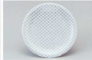
⑯ 1-509-17 M 寿司皿 西陣銀市松 ¥1,600