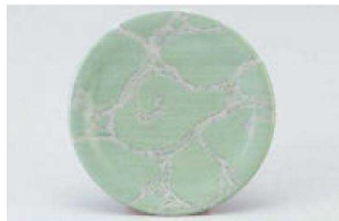
⑨ 1-509-13 M 寿司皿 西陣能登 ¥1,300