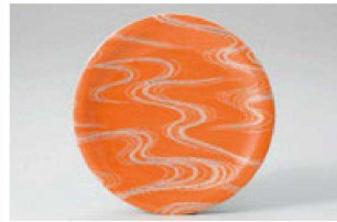
⑦ O-7-20 M 寿司皿 西陣橙流水 ¥1,600