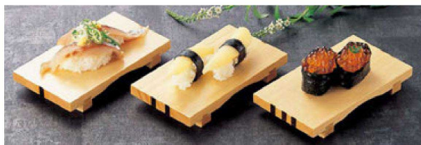
⑰ O-4-75 M 白木寿司ゲタ 一本線 ¥2,700 (15.5×8.7×2.2)