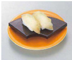
⑮ O-2-22 TA扇型高台ゲタ 梨地 底面N.S加工 ¥430(14.5×8×2) 梱300