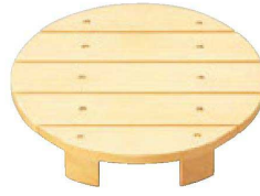
⑳ 困丸目皿滑り止め付 O-6-18 ¥2,800(11.5φ×2.1)