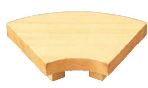
㉑ 困扇子型盛台滑り止め付 O-6-16 ¥2,800(14.3×9×3.1)