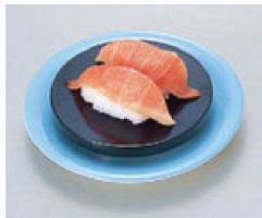
⑯ O-2-15 TA丸型高台ゲタ 黒 底面N.S加工 ¥430(10.9φ×2.2) 梱300