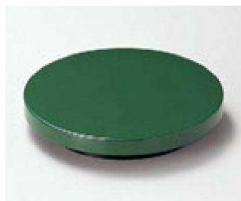
⑪ O-3-71 TA丸型高台ゲタ グリーン 底面N.S加工 ¥430(10.9φ×2.2) 梱300