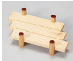
② O-8-59 困ハツ橋ミニ ¥1,450(11×6.5×2.5)