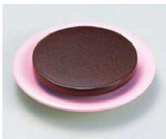
⑬ O-2-16 TA丸型高台ゲタ 梨地 底面N.S加工 ¥430(10.9φ×2.2) 梱300