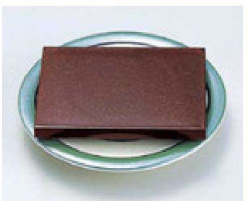
⑭ O-2-19 TA長角高台ゲタ 梨地 底面N.S加工 ¥430(12×9×2) 梱300