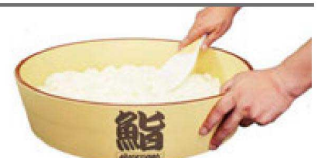
㉒ 樹脂製抗菌飯台 直送 O-8-7 尺6寸 ¥87,000(48φ×11) O-8-8 2尺 ¥120,000(60φ×14) O-8-9 2尺4寸 ¥154,000(72φ×17)

※この頁の商品は、一部掛率が異なりますのでご注意ください。 直送 商品はメーカーから直送の為、運賃は別途請求になります。