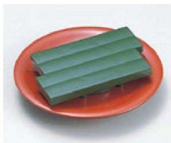
⑩ O-2-23 TAイカダ型高台ゲタ(大) グリーン 底面N.S加工 ¥430(12×7.5×2) 梱300