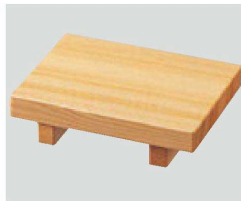
① O-3-64 困(小)木製寿司ゲタ ¥1,800(12×9×3) 梱300