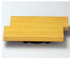
⑥ O-3-68 TAイカダ型高台ゲタ(大) 白木塗 底面N.S加工 ¥580(12×7.5×2) 梱300