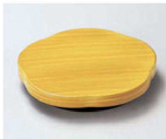
⑦ O-3-69 TA梅型高台ゲタ 白木塗 底面N.S加工 ¥580(10.7×10.7×2) 梱300