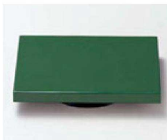
⑫ O-3-72 TA長角高台ゲタ グリーン 底面N.S加工 ¥430(12×9×2) 梱300