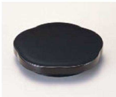
⑱ O-2-12 TA梅型高台ゲタ 黒 底面N.S加工 ¥430(10.7×10.7×2) 梱300