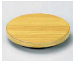
③ O-2-25 TA丸型高台ゲタ 白木塗 底面N.S加工 ¥580(10.9φ×2.2) 梱300