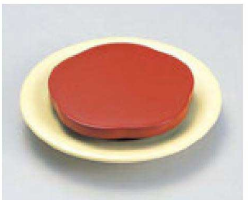
⑲ O-2-11 TA梅型高台ゲタ 朱 底面N.S加工 ¥430(10.7×10.7×2) 梱300