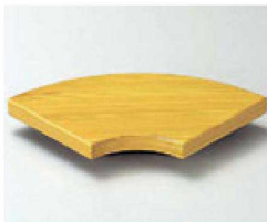
⑧ O-3-70 TA扇型高台ゲタ 白木塗 底面N.S加工 ¥580(14.5×8×2) 梱300