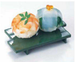
⑨ O-2-24 TAイカダ型高台ゲタ(小) グリーン 底面N.S加工 ¥430(11×6.6×1.4) 梱300