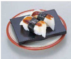
⑰ O-2-18 TA長角高台ゲタ 黒 底面N.S加工 ¥430(12×9×2) 梱300