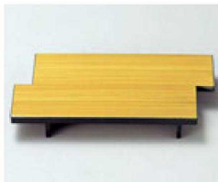
⑤ O-3-67 TAイカダ型高台ゲタ(小) 白木塗 底面N.S加工 ¥580(11×6.6×1.4) 梱300