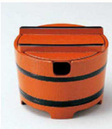
⑫ O-3-79 A 桶型ガリ入れ 朱木目天黒(切込有) ¥1,600(10.8φ×8.3) 梱80