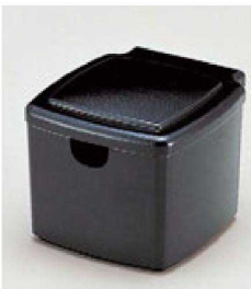
⑦ 1-511-1 A 隅丸ガリ入れ 黒刷毛目(切込有) ¥2,400(10×11.1×8.8) 梱80