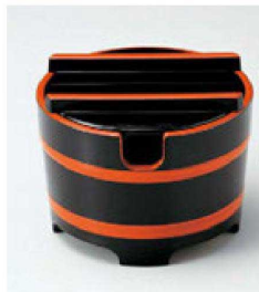
⑬ O-3-80 A 桶型ガリ入れ 黒帯朱(切込有) ¥1,600(10.8φ×8.3) 梱80