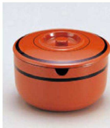
⑩ 1-511-8 A ガリ入れ 朱に帯黒(切込有) ¥1,800(11.8φ×7.8) 梱80