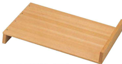
⑳ 困木製造り板S型 1-745-28 (小) ¥5,600(42×21×5.5) 梱20 1-745-29 (大) ¥7,000(45×30×5.5) 梱20