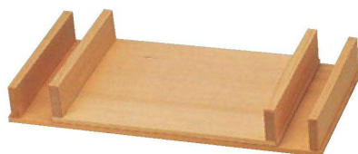
⑲ 困木製抜き板 1-745-26 (小) ¥4,800(30×21×5.5) 梱20 1-745-27 (大) ¥5,500(42×21×5.5) 梱20