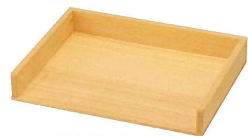
㉑ 困木製造り板 1-745-30 (小) ¥7,300(36×27×6) 梱10 1-745-31 (大) ¥7,700(39×30×6) 梱10