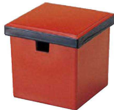
② O-1-95 A (小)角ガリ入れ 朱刷黒(切込有) ¥1,850(11×11×10.9) 梱80