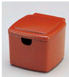
⑧ 1-511-2 A 隅丸ガリ入れ 朱刷毛目(切込有) ¥2,400(10×11.1×8.8) 梱80