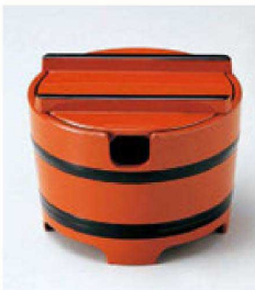
⑭ 1-511-7 A 桶型ガリ入れ 朱帯黒(切込有) ¥1,600(10.8φ×8.3) 梱80