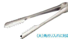
⑯ O-3-82 ステンレストング(中) ¥700(15L) (大)角ガリ入れに対応