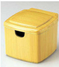
⑨ 1-511-3 A 隅丸ガリ入れ 白木塗(切込有) ¥2,400(10×11.1×8.8) 梱80