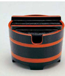
⑪ 1-511-6 A 桶型ガリ入れ 黒木目天朱(切込有) ¥1,600(10.8φ×8.3) 梱80