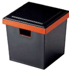
③ O-1-94 A (大)角ガリ入れ 黒刷朱(切込有) ¥2,600(12×12×11.6) 梱80