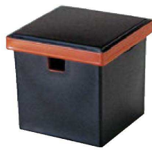
① O-1-93 A (小)角ガリ入れ 黒刷朱(切込有) ¥1,850(11×11×10.9) 梱80