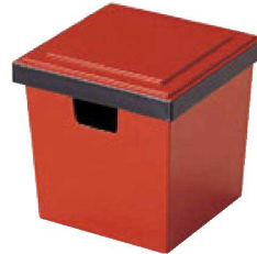
④ O-1-96 A (大)角ガリ入れ 朱刷黒(切込有) ¥2,600(12×12×11.6) 梱80