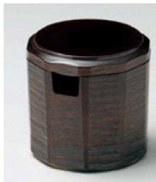
⑥ O-6-2 A 木彫ガリ入れ 柘 ¥2,950(10.5φ×10.5) 梱100