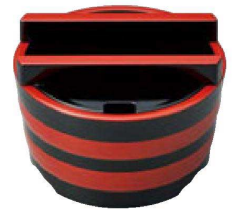
⑤ O-8-73 A 5寸桶型ガリ入れ 黒帯朱内黒 ¥4,800(16.1φ×10.7) 梱40