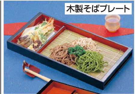
木製そばプレート