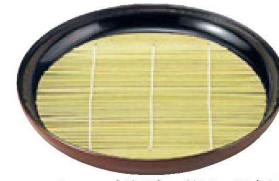
⑲ 7.5寸寿ザル 溜カスリ内黒 S-7-42 [A] 本体 ¥2,000 (22.7φ×3.5) 横80 1-536-1B [B] 竹ス(19.5φ) 1枚 ¥400 (19.5φ)