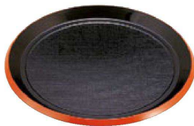
① 8寸丸布目そば皿 黒測朱 1-537-3 [A] 本体 ¥750 (23.5φ×3) 横80 1-536-1B [B] 竹ス(19.5φ) 1枚 ¥400 (19.5φ) S-10-50 [P.P.P.] 測付クリーム竹ス(19.5φ) 丸 ¥410 (19.5φ)