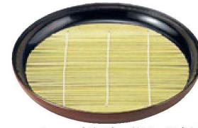
⑲ 7.5寸寿ザル 溜カスリ内黒 S-7-42 [A] 本体 ¥2,000 (22.7φ×3.5) 欄80 1-536-1B [B] 竹ス(19.5φ) 1枚 ¥400 (19.5φ)