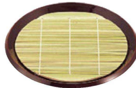
② 8寸丸布目そば皿 溜 1-537-4 [A] 本体 ¥850 (23.5φ×3) 欄80 1-536-1B [B] 竹ス(19.5φ) 1枚 ¥400 (19.5φ)