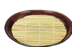
⑮ 白山そば皿 板 S-7-43 [A] 本体 ¥1,400 (24.3×22.7×3.4) 欄80 1-536-1B [B] 竹ス(19.5φ) 1枚 ¥400 (19.5φ)