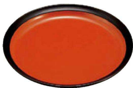
⑧ 名月そば皿 朱測黒 1-537-5 [A] 本体 ¥1,200 (22.8φ×2.6) 横80 1-536-1B [B] 竹ス(19.5φ) 1枚 ¥400 (19.5φ)