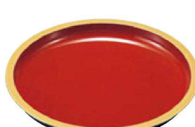
⑭ 大盛測太そば皿 朱天白木 S-8-21 [A] 本体 ¥900 (25.2φ×3.2) 欄60 1-536-1B [B] 竹ス(19.5φ) 1枚 ¥400 (19.5φ)