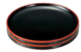
⑪ 樽型そば皿 朱帯黒(底板付) S-9-70 [A] 本体 ¥1,850 (21.2φ×3.4) 1-536-1B [B] 竹ス(19.5φ) 1枚 ¥400 (19.5φ)