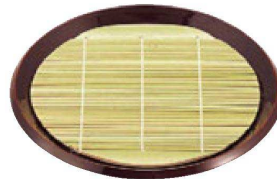
② 8寸丸布目そば皿 溜 1-537-4 [A] 本体 ¥850 (23.5φ×3) 横80 1-536-1B [B] 竹ス(19.5φ) 1枚 ¥400 (19.5φ)