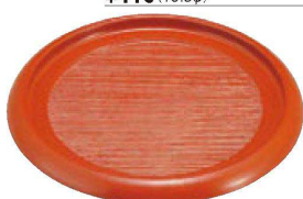
⑤ 8寸丸刷毛目そば皿 朱 1-537-1 [A] 本体 ¥750 (23.5φ×3) 横80 1-536-1B [B] 竹ス(19.5φ) 1枚 ¥400 (19.5φ)