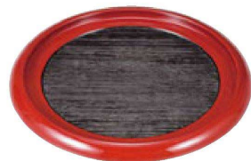
④ 8寸丸刷毛目そば皿 赤溜春慶 S-10-79 [A] 本体 ¥1,550 (23.5φ×3) 欄80 1-536-1B [B] 竹ス(19.5φ) 1枚 ¥400 (19.5φ)