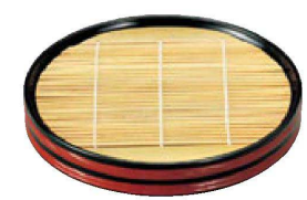
⑩ 樽型そば皿 黒帯朱(底板付) S-9-69 [A] 本体 ¥1,850 (21.2φ×3.4) 1-536-1B [B] 竹ス(19.5φ) 1枚 ¥400 (19.5φ)