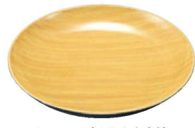
⑰ 24cm多用皿 白木塗 S-8-19 [A] 本体 ¥1,800 (24.3φ×4) 欄60 1-536-1B [B] 竹ス(19.5φ) 1枚 ¥400 (19.5φ)