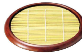
⑦ 8寸丸刷毛目そば皿 板塗(底板付) S-9-66 [A] 本体 ¥1,300 (23.5φ×3) 1-536-1B [B] 竹ス(19.5φ) 1枚 ¥400 (19.5φ)