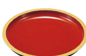
⑭ 大盛測太そば皿 朱天白木 S-8-21 [A] 本体 ¥900 (25.2φ×3.2) 横60 1-536-1B [B] 竹ス(19.5φ) 1枚 ¥400 (19.5φ)