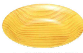
⑯ 7寸羽反丸そば皿 白木(ミニそば用) S-8-18 [A] 本体 ¥1,100 (21.4φ×4) 横80 S-7-25A [B] 竹ス(15φ) 1枚 ¥400 (15φ)