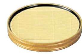
⑫ 樽型そば皿 白木帯金(底板付) S-9-71 [A] 本体 ¥2,350 (21.2φ×3.4) S-10-50 [P.P.P.] 測付クリーム竹ス 19.6φ 丸 ¥400 (19.6φ)