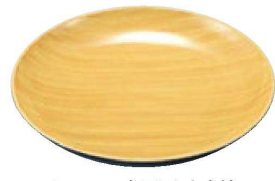
⑰ 24cm多用皿 白木塗 S-8-19 [A] 本体 ¥1,800 (24.3φ×4) 横60 1-536-1B [B] 竹ス(19.5φ) 1枚 ¥400 (19.5φ)