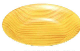
⑯ 7寸羽反丸そば皿 白木(ミニそば用) S-8-18 [A] 本体 ¥1,100 (21.4φ×4) 欄80 S-7-25A [B] 竹ス(15φ) 1枚 ¥400 (15φ)