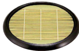
⑥ 8寸丸刷毛目そば皿 黒 1-537-2 [A] 本体 ¥750 (23.5φ×3) 欄80 1-536-1B [B] 竹ス(19.5φ) 1枚 ¥400 (19.5φ)