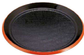
① 8寸丸布目そば皿 黒測朱 1-537-3 [A] 本体 ¥750 (23.5φ×3) 欄80 1-536-1B [B] 竹ス(19.5φ) 1枚 ¥400 (19.5φ) S-10-50 [P.P.P.] 測付クリーム竹ス(19.5φ) 丸 ¥410 (19.5φ)