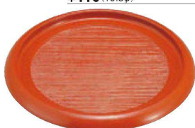
⑤ 8寸丸刷毛目そば皿 朱 1-537-1 [A] 本体 ¥750 (23.5φ×3) 欄80 1-536-1B [B] 竹ス(19.5φ) 1枚 ¥400 (19.5φ)