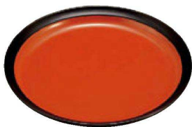
⑧ 名月そば皿 朱測黒 1-537-5 [A] 本体 ¥1,200 (22.8φ×2.6) 欄80 1-536-1B [B] 竹ス(19.5φ) 1枚 ¥400 (19.5φ)