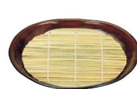
⑮ 白山そば皿 板 S-7-43 [A] 本体 ¥1,400 (24.3×22.7×3.4) 横80 1-536-1B [B] 竹ス(19.5φ) 1枚 ¥400 (19.5φ)