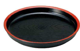
③ 7.5寸羽反そば皿 黒木目天朱 S-9-44 [A] 本体 ¥950 (22.2φ×3) 1-536-1B [B] 竹ス(19.5φ) 1枚 ¥400 (19.5φ)