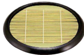
⑥ 8寸丸刷毛目そば皿 黒 1-537-2 [A] 本体 ¥750 (23.5φ×3) 横80 1-536-1B [B] 竹ス(19.5φ) 1枚 ¥400 (19.5φ)