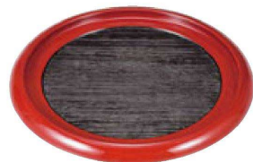
④ 8寸丸刷毛目そば皿 赤溜春慶 S-10-79 [A] 本体 ¥1,550 (23.5φ×3) 横80 1-536-1B [B] 竹ス(19.5φ) 1枚 ¥400 (19.5φ)