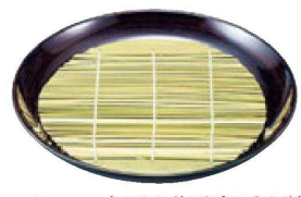
⑱ 24cm多用皿 茶刷毛目底黒塗 S-8-20 [A] 本体 ¥2,200 (24.3φ×4) 横60 1-536-1B [B] 竹ス(19.5φ) 1枚 ¥400 (19.5φ)