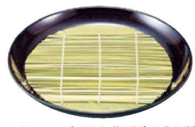
⑱ 24cm多用皿 茶刷毛目底黒塗 S-8-20 [A] 本体 ¥2,200 (24.3φ×4) 欄60 1-536-1B [B] 竹ス(19.5φ) 1枚 ¥400 (19.5φ)