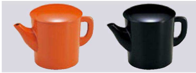
② 1-556-2 Aミニゆとう 黒朱(150cc) ¥1,550 (7.5φ×8) 櫃100