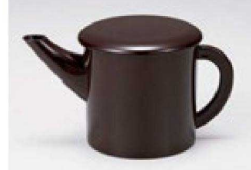
⑧ S-9-34 A(特大)ゆとう 朱(540cc) ¥3,300 (11.5φ×10.8) 櫃80