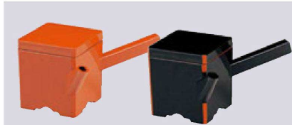
⑪ 1-556-10 A(小)角ゆとう 朱(350cc) ¥3,400 (9×9×10) 櫃60