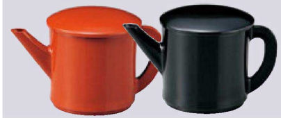
⑦ 1-556-9 A(大)ゆとう 黒(500cc) ¥2,400 (10.6φ×10.1) 櫃80