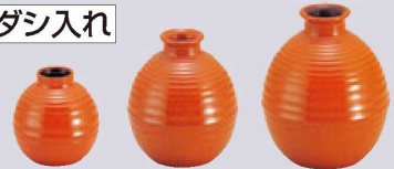
㉑ Aとっくりダシ入れ 朱 1-556-14 小 ¥800 (7φ×7.5・170cc) 櫃100 1-556-15 中 ¥1,200 (10φ×11.5・450cc) 櫃80 1-556-16 大 ¥1,500 (11.5φ×14・770cc) 櫃60