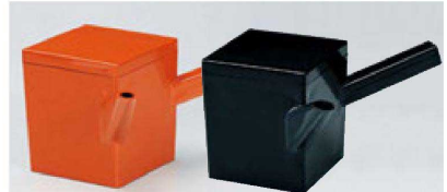
⑬ 1-556-12 A(大)角ゆとう 朱(620cc) ¥4,300 (10.8×10.8×12.8) 櫃40