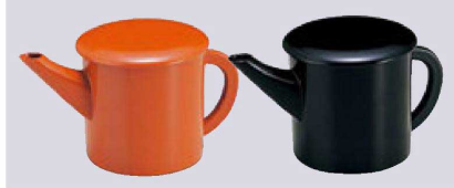
⑥ 1-556-8 A(大)ゆとう 朱(500cc) ¥2,400 (10.6φ×10.1) 櫃80