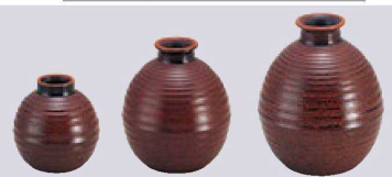
㉒ Aとっくりダシ入れ 溜刷毛目 1-556-17 小 ¥1,460 (7φ×7.5・170cc) 櫃100 1-556-18 中 ¥1,950 (10φ×11.5・450cc) 櫃80 1-556-19 大 ¥2,300 (11.5φ×14・770cc) 櫃60