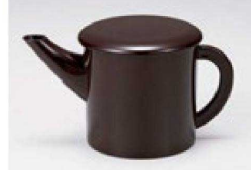
⑤ S-10-52 A(小)ゆとう 新溜(300cc) ¥2,300 (9φ×9.5) 櫃100