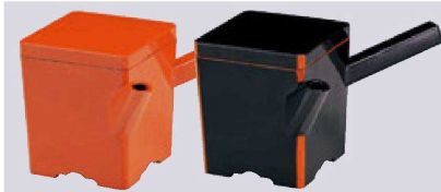
⑫ 1-556-11 A(小)角ゆとう 黒朱(350cc) ¥4,200 (9×9×10) 櫃60