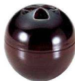
⑲ A源氏椀 溜 W-4-67 オヤ・フタ ¥2,000 (9.8φ×10.3) S-8-34 中子のみ ¥550