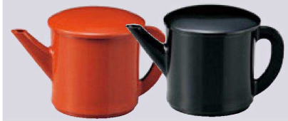
④ 1-556-7 A(小)ゆとう 黒(300cc) ¥1,550 (9φ×9.5) 櫃100