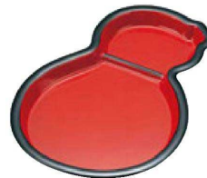
⑰ S-9-53 Mひさご仕切皿 朱天黒 ¥2,100 (27.6×19.1×2.4) 櫃80