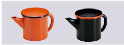
① 1-556-1 Aミニゆとう 朱黒(150cc) ¥1,550 (7.5φ×8) 櫃100