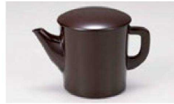
③ 1-556-6 A(小)ゆとう 朱(300cc) ¥1,550 (9φ×9.5) 櫃100