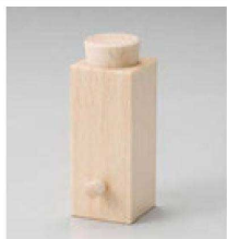
⑱ S-10-59 木角型薬味入 ¥2,900 (3.1×4.1×8.3) 梱200