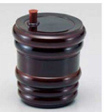
⑳ S-8-80 AC タル型七味入れ 溜 ¥880 (5.8φ×7) 梱200