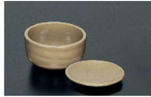
③ K-5-4-3 M 重ね鉢(小)粉引 K-JW-5 ¥660 (9.6φ×5・240ml) 梱120