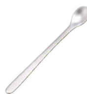
㉕ O-7-2 ステンレス(小)スプーン ¥330 (8.6L)