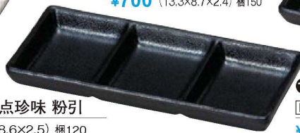
⑭ M-23-95 M いぶし釉3点珍味 粉引 ¥900 (19.6×8.6×2.5) 梱120