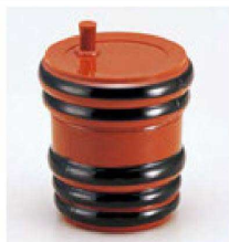
⑲ 1-560-9 AC タル型七味入れ 朱に帯黒 ¥650 (5.8φ×7) 梱200