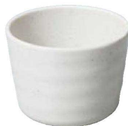
⑨ S-10-63 M いぶし釉つゆ入れ 粉引 ¥670 (8.5φ×6.5・230cc)

いぶし釉シリーズは陶器の質感を再現しております。本シリーズの商品は、表面に当社が開発した特殊加工を施しておりますので、傷や汚れや指紋がつきにくくなっております。