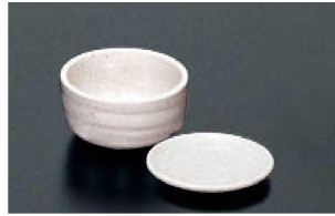
② W-6-4-2 M 重ね鉢(小)那智 N-JW-6 ¥380 (9.6φ×1.3) 梱250