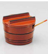
㉓ S-8-82 M (小) 桶型ヤクミ入れ 朱帯黒(小さじ付) ¥2,150 (5.3φ×4.1) 梱300