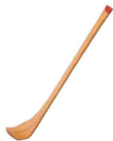
㉔ S-10-58 竹小さじ ¥600 (1×7.5)