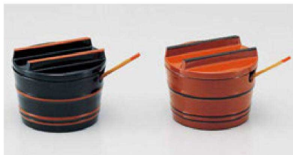
㉒ S-8-81 M (小) 桶型ヤクミ入れ 黒帯朱(小さじ付) ¥2,150 (5.3φ×4.1) 梱300