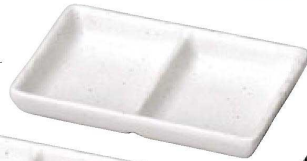
⑭ M-23-95 M いぶし釉3点珍味 粉引 ¥900 (19.6×8.6×2.5) 梱120