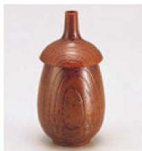
⑰ 1-560-10 A なす型薬味入れ ケヤキ ¥1,300 (5φ×10) 梱200