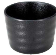
⑪ S-10-61 M いぶし釉つゆ入れ 黒 ¥670 (8.5φ×6.5・230cc)