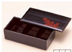
㉑ 1-560-16 M 3点薬味セット シダ ¥3,000 (16.3×8.4×5) 梱100