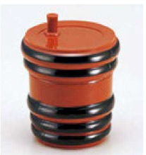
⑲ 1-560-9 AC タル型七味入れ 朱に帯黒 ¥650 (5.8φ×7) 梱200