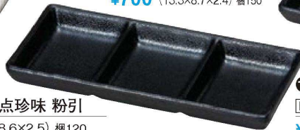
⑯ M-23-94 M いぶし釉3点珍味 黒 ¥900 (19.6×8.6×2.5) 梱120