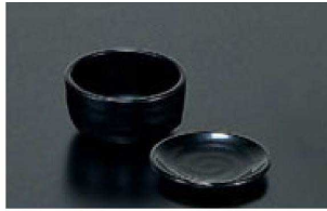
① W-5-4-2 M 重ね鉢(小)那智 N-JW-5 ¥660 (9.6φ×5・240ml) 梱120