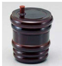
⑳ S-8-80 AC タル型七味入れ 溜 ¥880 (5.8φ×7) 梱200