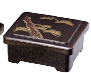
⑪ TA耐熱錦丼重 U-1-16 梨地二色松内朱塗 ¥4,400 (18.1×15.2×8.3) 幅50