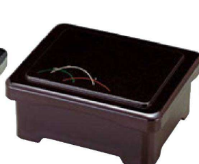
⑩ TA耐熱錦丼重 1-564-5 溜パール露草内朱塗 ¥4,300 (18.1×15.2×8.3) 幅50