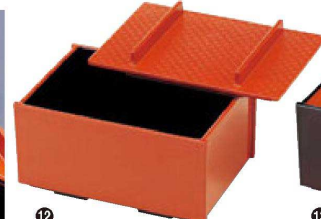
⑫ TA耐熱柳川丼重(底板付) 朱内黒塗 (19×13.2×10.8) 幅40 1-565-1 身 ¥3,250 1-565-1A 蓋 ¥1,850