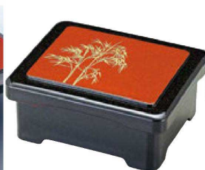
⑨ TA耐熱錦丼重 1-564-4 朱パール若竹内朱塗 ¥4,200 (18.1×15.2×8.3) 幅50