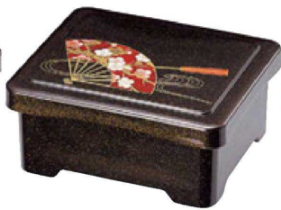
⑥ TA耐熱象足丼重 U-1-13 梨地新扇面内朱塗 ¥2,900 (16.8×14.3×7.6) 幅60