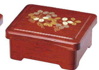
⑧ TA耐熱象足丼重 U-1-15 後藤塗萩内朱塗 ¥4,300 (16.8×14.3×7.6) 幅60