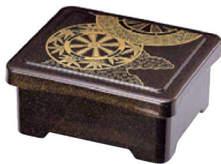
⑤ TA耐熱象足丼重 U-1-12 梨地御所車内朱塗 ¥2,650 (16.8×14.3×7.6) 幅60