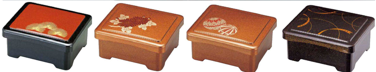
① TA耐熱象足丼重 1-564-1 朱パール若松内朱塗 ¥2,800 (16.8×14.3×7.6) 幅60