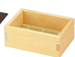
⑭ 困柳川丼重用 木杵 1-565-3 ¥2,950 (17×11.9×6.8)(内寸14.8×9.7×4.5) ⑮ 竹竹ス 1-526-2A ¥700 (14.5×9.4)