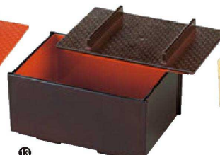
⑬ TA耐熱柳川丼重(底板付) 溜内朱塗 (19×13.2×10.8) 幅40 1-565-2 身 ¥3,950 1-565-2A 蓋 ¥2,250