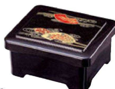
⑮ U-1-45 A (小) 象足丼重 茶パール扇面内朱塗 ¥1,650 (14.2×12.5×7) 欄60