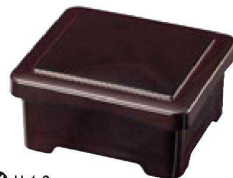
⑪ U-1-9 A (小) 象足丼重 溜内朱塗 ¥1,450 (14.2×12.5×7) 欄60