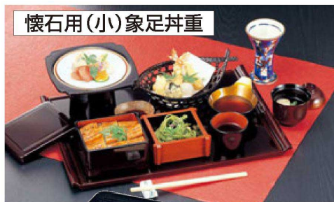
懐石用(小)象足丼重