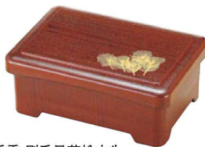
④ 1-568-3 A D.X長手重 刷毛目若松内朱 ¥4,200 (19.6×13.9×8) 欄50