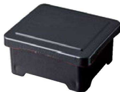
⑥ U-1-96 TA耐熱 (小) 象足丼重 新木目黒天朱(内黒) ¥1,400 (14.2×12.5×7) 欄60