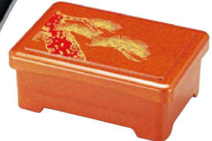
② 1-568-1 A D.X長手重 梨地赤松内朱 ¥3,450 (19.6×13.9×8) 欄50