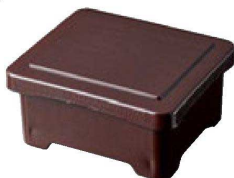
⑦ U-1-97 TA耐熱 (小) 象足丼重 新木目新溜内朱塗 ¥1,650 (14.2×12.5×7) 欄60