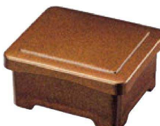
⑭ U-1-10 A (小) 象足丼重 梨地内朱塗 ¥1,450 (14.2×12.5×7) 欄60