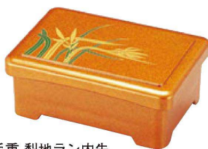
③ 1-568-2 A D.X長手重 梨地ラン内朱 ¥3,600 (19.6×13.9×8) 欄50