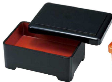
① U-1-78 A D.X長手重 黒内朱 ¥3,050 (19.6×13.9×8) 欄50