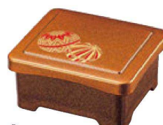
⑯ U-1-44 A (小) 象足丼重 梨地まり内朱塗 ¥1,650 (14.2×12.5×7) 欄60