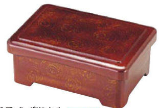
⑤ 1-568-9 A D.X長手重 うず潮内朱 エース塗 ¥7,400 (19.6×13.9×8) 欄50