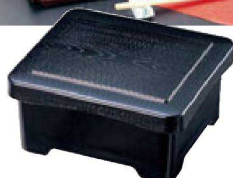
⑧ U-1-6 A (小) 象足丼重 新木目黒内朱塗 ¥1,350 (14.2×12.5×7) 欄60