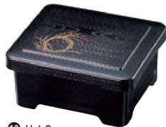
⑩ U-1-8 A (小) 象足丼重 新木目柳結び内朱塗 ¥1,550 (14.2×12.5×7) 欄60