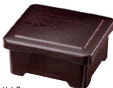
⑨ U-1-7 A (小) 象足丼重 新木目溜内朱塗 ¥1,450 (14.2×12.5×7) 欄60