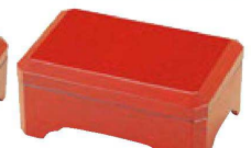
⑯ 1-579-3 M光月うなぎ平(大) 後藤塗内朱塗 ¥4,900 (17.5×11.6×7.7) 欄50