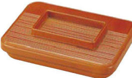
⑦ 1-578-10 A千筋うなぎ平 春慶内朱塗 ¥2,800 (18.5×13.7×5.7) 欄60