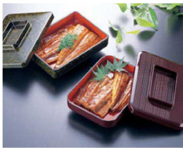
⑥ U-1-38 A千筋うなぎ平 新溜内朱塗 ¥2,400 (18.5×13.7×5.7) 欄60