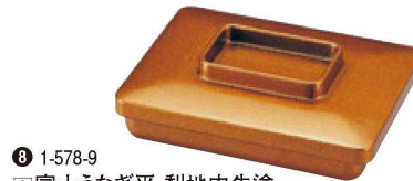
⑧ 1-578-9 A富士うなぎ平 梨地内朱塗 ¥2,950 (18.5×13.5×6.7) 欄60