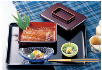
⑬ U-1-37 A(大)うなぎ平 新溜天朱内朱塗 ¥2,800 (18.9×14.1×6) 欄60