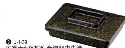
⑨ U-1-39 A富士うなぎ平 金津軽内朱塗 ¥4,100 (18.5×13.5×6.7) 欄60