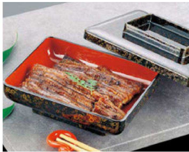
① 1-578-3 A隅丸うなぎ平 溜天朱内朱 ¥1,950 (16.9×12.6×5.8) 欄80