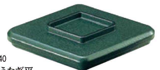
⑰ U-1-40 A菱型うなぎ平 グリーン石目天黒内朱塗 ¥3,100 (24×17.2×5.8) 欄60