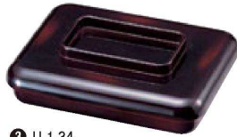
③ U-1-34 A隅丸うなぎ平 曙内朱 ¥2,400 (16.9×12.6×5.8) 欄80