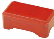
⑮ 1-579-1 M光月うなぎ平(小) 後藤塗内朱塗 ¥3,800 (14.9×8.7×5.5) 欄50