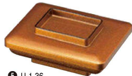
⑤ U-1-36 Aうなぎ平 金梨地天黒内朱塗 ¥2,300 (16.4×12.9×6.1) 欄80