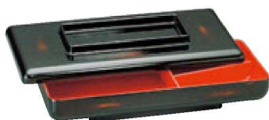
⑪ M長手うなぎ平 曙内朱(仕切付) 1-578-13 ¥7,300 (28.5×13×6.5) 欄40