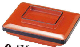
④ 1-578-6 Aうなぎ平 朱洌黒内朱塗 ¥2,000 (16.4×12.9×6.1) 欄80