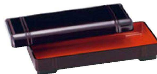
⑩ A竹型長手うなぎ平 溜内朱 U-1-59 ¥4,200 (27.5×12×6.4)