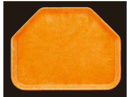
① FRP (SS-45)六角トレイ オレンジ WS 1-97-1 ¥2,600 (45×34×2) 楕30