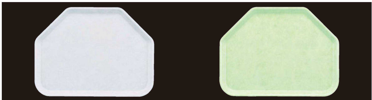
④ FRP (SS-45)六角トレイ グレー WS 1-97-5 ¥2,600 (45×34×2) 楕30