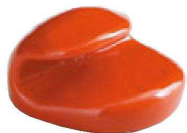
⑤ H-59-15 A 巻扇形箸置 朱 ¥380(4×3.7×2.4)