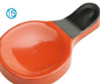
⑮ H-44-85 AC ツイン箸置 朱/黒 ¥440(9×5.3×1.2)