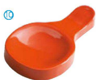
⑩ H-44-82 AC ツイン箸置 朱 ¥400(9×5.3×1.2)