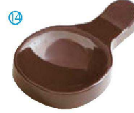
⑭ H-59-24 A ツイン箸置 新溜 ¥500(9×5.3×1.2)