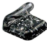
④ H-41-13 AC 巻物型箸置 銀河 ¥820(4.1×3.1×2.6)