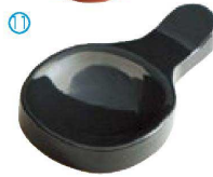
⑪ H-44-81 AC ツイン箸置 黒 ¥400(9×5.3×1.2)