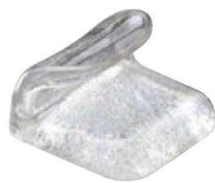
③ H-41-12 AC 巻物型箸置 ラメ ¥620(4.1×3.1×2.6)