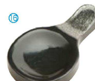
⑯ H-44-86 AC ツイン箸置 黒/銀パール ¥460(9×5.3×1.2)