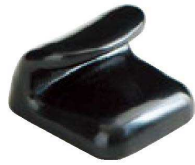
① H-59-16 A 巻物型箸置 黒 ¥380(4.1×3.1×2.6)