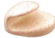
⑨ H-41-9 A 巻扇形箸置 桜志野 ¥720(4×3.7×2.4)