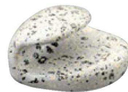
⑧ H-41-8 A 巻扇形箸置 石目塗 ¥720(4×3.7×2.4)