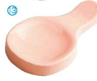
⑬ H-44-90 AC ツイン箸置 ピンク ¥550(9×5.3×1.2)