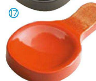
⑰ H-44-88 AC ツイン箸置 朱/金パール ¥460(9×5.3×1.2)