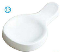
⑫ H-59-21 AC ツイン箸置 白 ¥550(9×5.3×1.2)