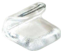
② H-59-17 AC 巻物型箸置 透明 ¥430(4.1×3.1×2.6)