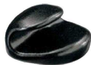
⑥ H-41-6 A 巻扇形箸置 黒乾漆 ¥620(4×3.7×2.4)