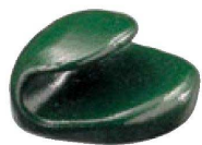
⑦ H-41-7 A 巻扇形箸置 グリーン石目 ¥620(4×3.7×2.4)