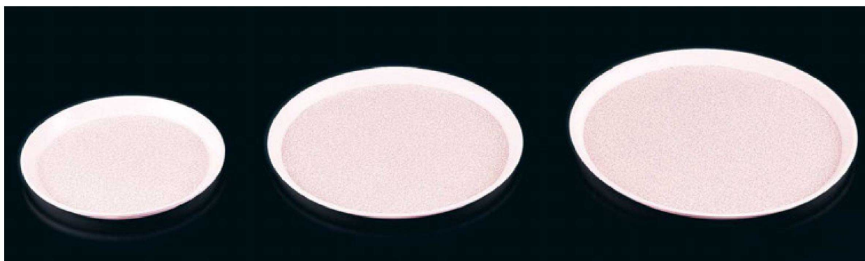
① FRP (F-28) 耐熱丸トレー B-4-61 ピンクモスト ノンスリップ加工 ¥3,950 (27.9φ×2) 梱50