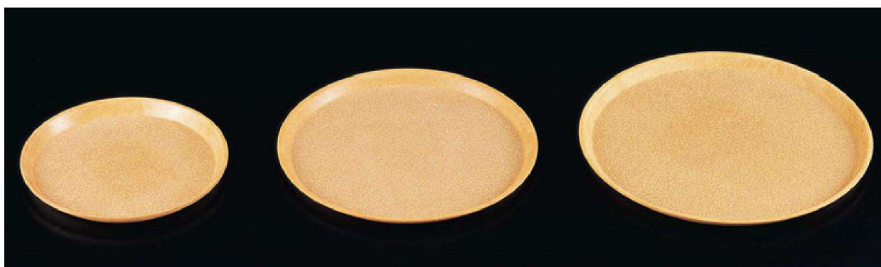
④ FRP (F-28) 耐熱丸トレー B-4-64 ブラウンモスト ノンスリップ加工 ¥3,950 (27.9φ×2) 梱50