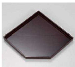
⑱ H-94-85 A 富士見皿 新溜 ¥600 (17.8×14.7×1.3) 欄200