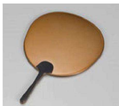
㉓ H-95-4 A うちわ皿 ブラウンメタ ¥950 (14.1×9.3×0.5) 欄200