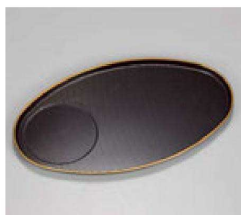
㉔ H-95-5 A 5.5寸小判皿 新溜天金 ¥850 (16.7×9.6×5) 欄200