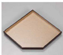
⑳ H-94-86 A 富士見皿 シャンパンゴールド測溜 ¥1,250 (17.8×14.7×1.3) 欄200