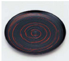
② 1-759-18 A 5.5寸木彫り丸皿 古代曙 ¥1,250 (16.7φ×1.4) 欄200