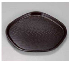
⑬ H-94-87 A 4.5寸 木目白梅皿 新溜 ¥600 (15.5×12.9×1.1) 欄200