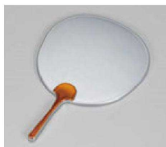
㉒ H-95-1 A うちわ皿 銀塗 ¥950 (14.1×9.3×0.5) 欄200