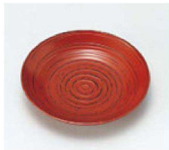
④ H-8-81 A 4.8寸象こく菓子皿 根来 ¥1,300 (14.5φ×2.8) 欄200