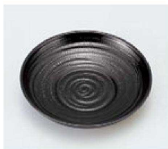
⑮ 1-759-12 M 象こく菓子皿 黒 ¥1,200 (13.7φ×2.1) 欄200