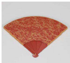
⑧ H-94-93 A 扇面皿 朱金乱糸 ¥950 (15.1×11.2×0.5) 欄200