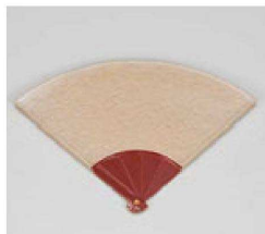
⑨ H-94-94 A 扇面皿 ベージュ雲流 ¥950 (15.1×11.2×0.5) 欄200