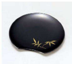
⑦ H-8-83 M 半月銘々皿 黒に笹 ¥2,150 (14.7×13.9×1.3) 欄200