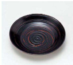
③ H-8-80 A 4.8寸象こく菓子皿 曙 ¥1,300 (14.5φ×2.8) 欄200