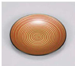
⑩ H-93-55 A 5寸菓子皿 金渦 ¥1,350 (14.9φ×1.5) 欄200