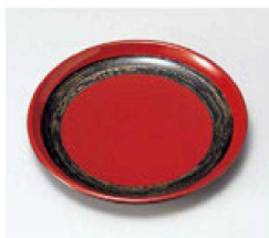
㉖ H-8-96 A お好み銘々皿 赤に金かすり ¥1,150 (16φ×2) 欄200