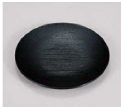
⑤ H-93-54 A 5寸菓子皿 黒刷毛目 ¥950 (14.9φ×1.5) 欄200