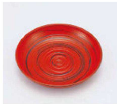
① 1-759-17 A 4.5寸木彫り丸皿 古代根来 ¥1,000 (13.6φ×2.4) 欄200