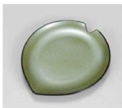
⑰ H-94-90 A 花びら皿 グリーン雲流 ¥850 (14.2×12.4×1.4) 欄200