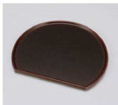
⑫ A 6寸半月銘々皿 黒天金 H-94-38 ¥1,650 (18.5×15.8×1)