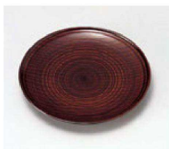
㉑ H-8-97 A 木目銘々皿 栃 ¥1,100 (15φ×2.1) 欄200