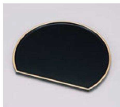
⑪ A 5.5寸半月銘々皿 黒天金 H-94-37 ¥1,450 (16.5×13.7×0.9)