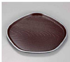
⑭ H-94-88 A 4.5寸 木目白梅皿 銀朱天銀 ¥650 (15.5×12.9×1.1) 欄200