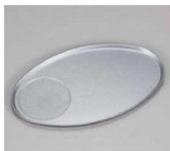
㉕ H-95-8 A 5.5寸小判皿 銀塗 ¥850 (16.7×9.6×5) 欄200