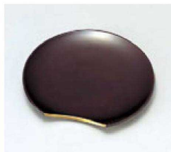
⑥ H-8-82 M 半月銘々皿 溜測金 ¥1,600 (14.7×13.9×1.3) 欄200