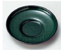
⑭ H-8-98 M 4寸だるま茶托 グリーンかすり布目 ¥1,400 (12φ×2) 梱200