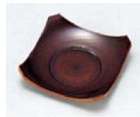
㉕ H-8-50 A 隅切茶托 栃 ¥980 (9.5×9.5×2.2) 梱200