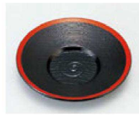
⑦ 1-760-15 A 4寸乱筋茶托 黒朱ライン ¥750 (12.2φ×1.9) 梱200