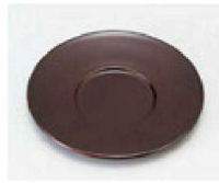
⑱ 1-760-4 A 平茶托 溜 ¥750 (11.5φ×1) 梱200