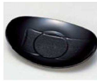
③ H-9-1 M 小判茶托 (大) 黒一筆 ¥1,350 (15.4×10.4×2.6) 梱200