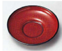
⑮ H-8-99 M 4寸だるま茶托 朱かすり布目 ¥1,400 (12φ×2) 梱200