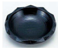
㉚ 1-762-4 A 4寸D.X亀甲茶托 黒 ¥880 (12φ×2.8) 梱200