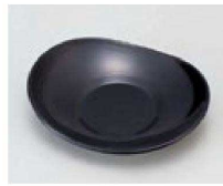
① H-70-54 A 小判茶托 黒 ¥500 (12.2×10.2×2.4) 梱200