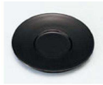
⑯ 1-760-1 A 平茶托 黒 ¥650 (11.5φ×1) 梱200