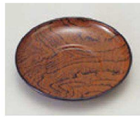
⑧ 1-762-13 A 4寸丸茶托 新ケヤキ ¥1,300 (12φ×2) 梱200