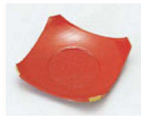
㉓ 1-760-9 A 隅切茶托 朱溜金 ¥650 (9.5×9.5×2.2) 梱200