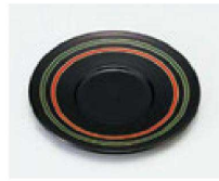
㉑ 1-760-6 A 平茶托 ライン ¥1,050 (11.5φ×1) 梱200