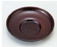
⑬ 1-760-13 M 4寸だるま茶托 溜布目 ¥1,400 (12φ×2) 梱200