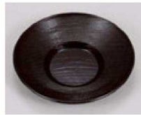
⑪ H-93-56 A 3.6寸ケヤキ千筋木目 茶托 新溜 ¥600 (10.3φ×1.6) 梱200