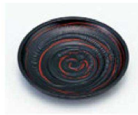
⑥ 1-760-3 A 4寸木彫り茶托 古代曙 ¥1,000 (12φ×1.9) 梱200