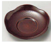
⑩ H-9-13 M 4寸梅木彫茶托 栃 ¥1,200 (11.5φ×2.1) 梱200