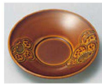
㉘ H-9-16 M 梅彫茶托 漆調春慶塗 ¥1,400 (12φ×2.2) 梱200