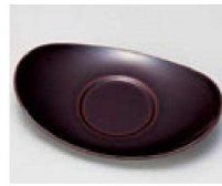
④ H-9-2 M 小判茶托 (大) 漆調溜塗 ¥1,450 (15.4×10.4×2.6) 梱200