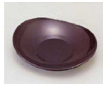
② H-70-55 A 小判茶托 溜 ¥700 (12.2×10.2×2.4) 梱200