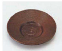
㉖ 1-760-11 A 3.8寸乱筋茶托 溜 ¥580 (11.5φ×1.9) 梱200