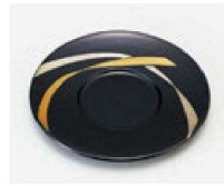
⑳ 1-760-5 A 平茶托 黒花帯 ¥1,250 (11.5φ×1) 梱200