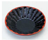
㉛ 1-762-8 A 菊花茶托 黒天朱 ¥900 (12φ×2.3) 梱200