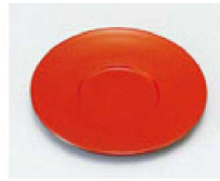
⑰ 1-760-2 A 平茶托 朱 ¥650 (11.5φ×1) 梱200