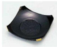
㉒ 1-760-8 A 隅切茶托 黒溜金 ¥650 (9.5×9.5×2.2) 梱200