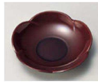
⑨ H-9-7 M 4寸ねじ梅茶托 溜春慶 ¥1,250 (12φ×2.2) 梱200