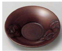
㉗ H-9-15 M 梅彫茶托 栃 ¥1,400 (12φ×2.2) 梱200