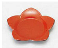
㉙ 1-762-6 A きぎょう茶托 朱 ¥700 (11.5×11.2×1.7) 梱200