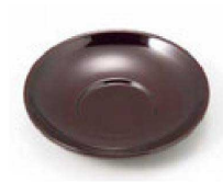
⑫ H-45-73 M 4寸だるま茶托 溜 ¥1,450 (12φ×2) 梱200