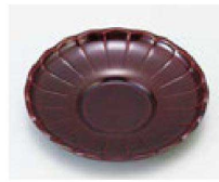
⑤ 1-762-7 M 菊花茶托 溜 ¥1,200 (12.1φ×2.1) 梱200