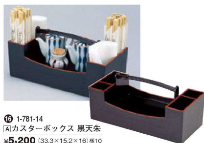
⑯ 1-781-14 A カスターボックス 黒天朱 ¥5,200 (33.3×15.2×16) 横10