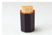
⑰ 1-514-14 A 八角妻楊子入れ 黒天朱 ¥550 (4×4×5.6) 横200