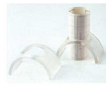
⑮ H-19-95 直送 ESW-2 お会計伝票入れ ¥800 (7.5×3.8)