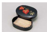
㉒ 1-514-17 M 小判楊子入れ ツタ ¥1,550 (9.5×6.5×2.4) 横200