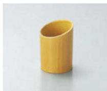
⑭ H-42-28 AC 伝票立て 白木 (底板付) ¥850 (4.7φ×7) 横300