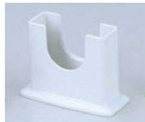
② H-7-21 A ナフキン立て ホワイト ¥1,300 (12.5×5.8×9.6) 横100