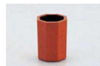
⑱ 1-514-15 A 八角妻楊子入れ ワインパール天朱 ¥570 (4×4×5.6) 横200