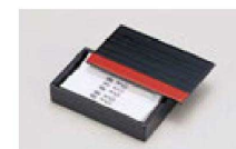
㉔ 1-777-10 困楊子入れ 黒/朱 ¥3,000 (10×7.4×3) 横100

限定品 海外生産の為、在庫を確認の上ご注文ください。 ※この頁の青字価格の商品は、掛率が異なりますのでご注意ください。 直送 この頁の⑤、⑨、⑩、⑪、⑮の商品はメーカーから直送の為、運賃は別途請求になります。