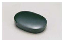
⑳ 1-777-5 M 小判楊子入れ グリーン乾漆 ¥1,400 (9.5×6.5×2.4) 横200