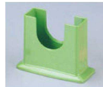
③ H-7-22 A ナフキン立て グリーン ¥1,300 (12.5×5.8×9.6) 横100