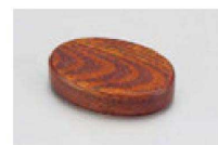
㉓ 1-514-20 限定品 M 小判楊子入れ スリ漆 ¥1,500 (8.7×5.8×2.9) 横200