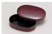
㉑ 1-777-6 M 小判楊子入れ 茶乾漆 ¥1,400 (9.5×6.5×2.4) 横200