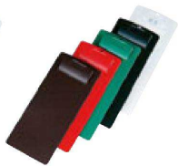
⑩ H-2-57 直送 CLIP-102 伝票ホルダー A 赤・B 茶・C 緑・D 黒・E 透明 ¥600 (9×21)