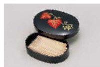
㉒ 1-514-17 M 小判楊子入れ ツタ ¥1,550 (9.5×6.5×2.4) 横200