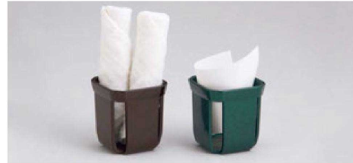
⑦ H-4-97 A おしぼり&伝票立て 茶パール ¥700 (6.6×6.6×7.2) 横200