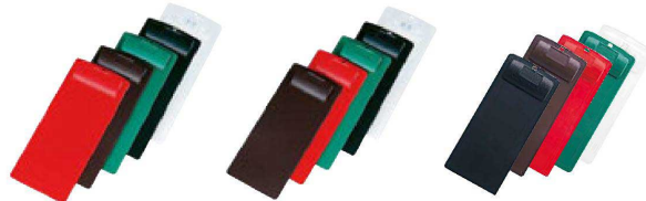
⑨ H-2-56 直送 CLIP-101 伝票ホルダー A 赤・B 茶・C 緑・D 黒・E 透明 ¥650 (10×23)