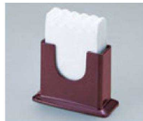
① H-7-20 A ナフキン立て ブラウン ¥1,200 (12.5×5.8×9.6) 横100