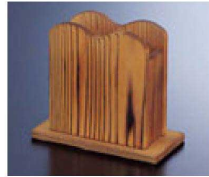
⑤ 1-778-15 直送 困ねずコナフキン立て ¥1,750 (14×7×12.2) 横100