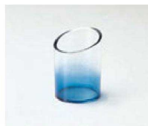
⑬ H-9-74 AC 伝票立て ブルー (底板付) ¥650 (4.7φ×7) 横300