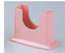
④ H-7-23 A ナフキン立て ピンク ¥1,300 (12.5×5.8×9.6) 横100