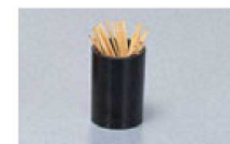
⑲ K-105-16-7 M WK-11 ようじ立て (黒) ¥400 (5.8φ×4.2) 横200