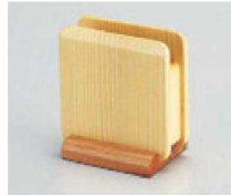
⑥ 1-784-6 限定品 困角ナフキン立て 白木 ¥2,400 (11×7.5×12)