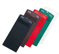
⑪ H-19-96 直送 CLIP-103 伝票ホルダー A 赤・B 茶・C 緑・D 黒・E 透明 ¥550 (8.5×18)