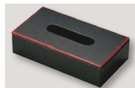
⑱ H-35-64 困ティッシュボックス 浅型黒天朱 ¥9,700 (27×14.5×6.5・内寸5.5H) 横20