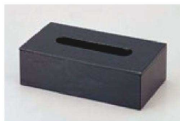
⑬ 1-811-12 困ティッシュボックス 黒木目 ¥11,500 (26.7×14.5×8) 横10