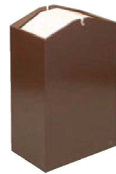
⑨ H-38-17 困アローズダストBOX/W (容量15ℓ) ブラウン ¥16,000 (27×16.5×45) 横5