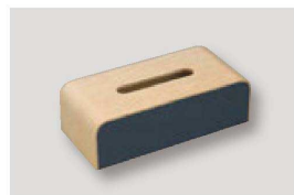
⑳ H-38-7 困ウッディティッシュBOX ネイビー ¥8,000 (28.5×13.5×9) 横10