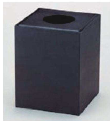
② 1-811-3 困くず入れ 黒乾漆 ¥13,000 (19.1×19.1×24.2) 横10