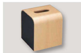
㉒ H-38-13 困ウッディティッシュBOX ブラック ¥8,000 (13×13×15) 横20