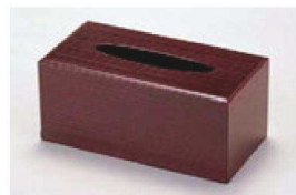
⑫ 1-811-10 困ティッシュボックス 溜(箱付) ¥11,500 (27.6×14×12.2) 横10