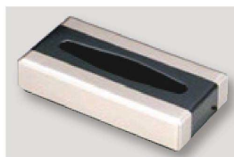
⑰ H-37-55 困D.X低型ティッシュボックス 銀塗り分け ¥4,800 (27.7×14.1×5.8) 横20