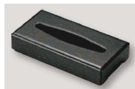
⑯ H-35-67 困D.X低型ティッシュボックス 金津軽 ¥4,400 (27.7×14.1×5.8) 横20