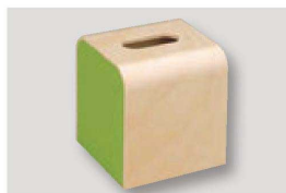
㉑ H-38-8 困ウッディティッシュBOX ライトグリーン ¥8,000 (13×13×15) 横20