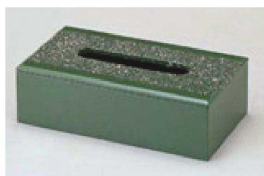
⑮ 1-811-14 困ティッシュボックス グリーン乾漆吹雪 ¥12,000 (28.4×15.3×8.4) 横10