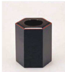
④ 1-811-5 困六角くず入れ 黒千筋天朱(小) ¥9,900 (18×15.8×20) 横10