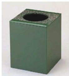
⑥ 1-811-7 困くず入れ グリーン乾漆吹雪 ¥12,800 (18×18×22.2) 横10