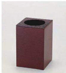
① 1-811-2 困くず入れ カナ目総溜 ¥14,000 (14.6×14.6×21.7) 横10