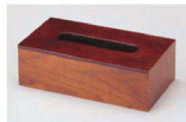
⑭ 1-811-13 困ティッシュボックス ケヤキ木目 ¥11,500 (26.7×14.5×8) 横10