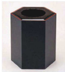
⑤ 1-811-6 困六角くず入れ 黒千筋天朱(大) ¥12,500 (22.5×19.6×25.3) 横10