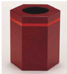
③ 1-811-4 限定品 困くず入れ 茶乾漆ライン ¥10,500 (23.5×19.5×25.1) 横10