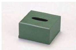
⑪ 1-811-9 困(ミニ)ティッシュボックス 淡グリーン乾漆 ¥8,500 (15×14×8) 横20