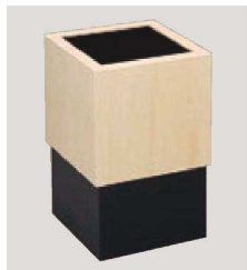
⑦ H-38-15 困キューブスライドダストBOX 黒 ¥14,000 (20×20×33) 横6