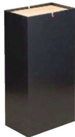
⑩ H-38-18 困のっぽダストBOX/W (容量20ℓ) ブラック ¥19,000 (18×30×60) 横5