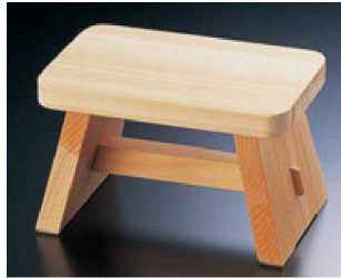
② 困風呂椅子 H-12-50 (小) ¥10,000 (25.5×16×16) 梱10