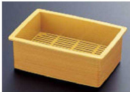
⑨ 1-832-6 A石詰め入れ 白木塗 ¥1,200 (16.9×11.9×6.2) 梱60