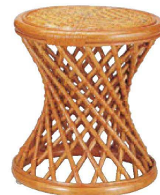
⑭ H-3-75 藤ラタンスツール 直送 ¥23,000 (38φ×41) 梱6

[直送] 商品はメーカーから直送の為、運賃は別途請求になります。 ※この頁の商品は、掛率が異なりますのでご注意ください。