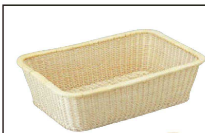
⑩ 1-837-4 藤脱衣かご C-20 直送 ¥12,300 (54×38×15) 梱20