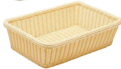
⑪ PP樹脂脱衣かご ステンレス枠 直送 M-26-87 (小) ¥19,000 (50×38×15) 梱10 M-26-86 (大) ¥21,000 (55×38×15) 梱10