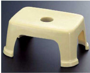
① PP風呂椅子 クリーム 1-832-1 ¥2,300 (31×22.2×13.5) 梱20