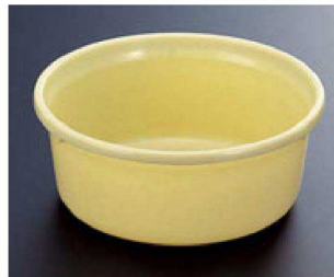
⑦ 1-832-3 A風呂桶 クリーム ¥1,300 (25φ×10) 梱20