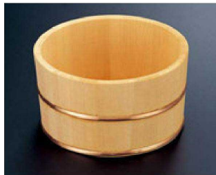
⑥ 1-832-11 困湯桶 ¥7,000 (23φ×11.5) 梱10