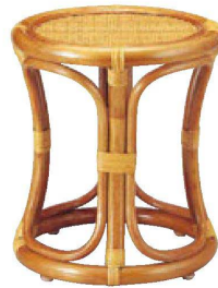
⑬ 1-836-13 藤丸椅子 直送 ¥18,500 (32φ×37) 梱6