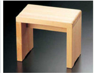
④ 困風呂椅子 コの字型 H-19-68 (小) ¥10,500 (30×18×25) 梱10 H-19-69 (大) ¥11,500 (30×20×30) 梱10