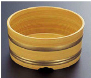
⑤ 1-832-4 A風呂桶 白木塗金線 ¥2,400 (22.2φ×10) 梱10