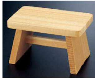
③ 困風呂椅子 1-832-7 (中) ¥11,500 (30×18×23) 梱10 1-832-8 (大) ¥12,500 (30×10×30) 梱10