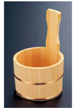
⑧ 1-832-10 困片手桶 ¥7,600 (15.5φ×24) 梱20