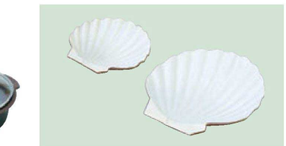
㉕ 1-839-17 直送 [AL] ホタテ陶板 (小) ¥3,500 (12φ×2.5)