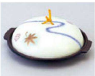
⑩ 1-841-9 直送 アルミ陶板焼19cm浅型 流水春秋(蓋陶器)(フッ素加工) ¥7,050 (19.3φ×7)