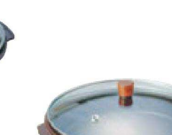
㉔ H-25-43 直送 [AL] ガラス蓋陶板 特深型 ¥6,400 (19φ×9.5H) (0.7ℓ)