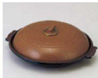
① アルミ陶板焼 直送 アカネチョコ(フッ素加工) 1-840-1 16cm浅型 ¥3,200 (16.5φ×6.5) 1-840-2 19cm浅型 ¥3,500 (19.3φ×7)