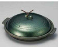
⑥ [AL] アルミ陶板焼 直送 いぶし緑(フッ素加工) H-98-39 16cm浅型 ¥3,500 (16.5φ×6.5) H-98-40 19cm深型 ¥3,800 (19.3φ×7.5)