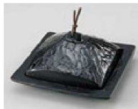
⑮ H-18-66 直送 [AL] 角陶板 黒蓋付 ¥5,300 (16.4×16.4×8.4)