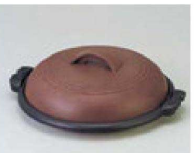
⑳ 1-843-33 直送 [AL] 大開陶板 煎茶 31cm(フッ素加工) ¥24,200 (31φ×10.5)