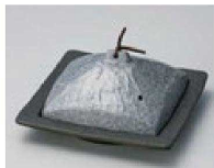
⑯ H-98-43 直送 [AL] 角陶板 石目(フッ素加工) ¥5,350 (16.4×16.4×8)