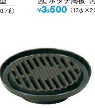
㉙ H-25-70 直送 [AL] 海鮮グリル鍋(フッ素加工) ¥5,550 (19φ×5) (0.3ℓ)