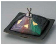
⑰ H-98-44 直送 [AL] 角陶板 金彩(フッ素加工) ¥6,600 (16.4×16.4×8)