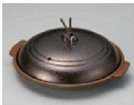
⑨ [AL] アルミ陶板焼 直送 いぶし銀(フッ素加工) H-98-41 16cm浅型 ¥3,500 (16.5φ×6.5) H-98-42 19cm浅型 ¥3,800 (19.3φ×7.5)