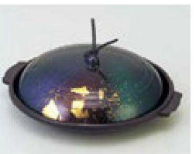
⑫ アルミ陶板焼深型 直送 金彩緑 1-841-4 ¥6,000 (19.3φ×6.5)