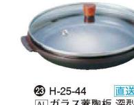
㉓ H-25-44 直送 [AL] ガラス蓋陶板 深型 ¥6,300 (19φ×7H) (0.46ℓ)