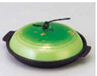
⑪ ミニ陶板焼浅型 直送 金彩緑 1-841-3 ¥5,200 (16.5φ×5.5)