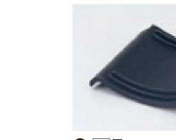
⑳ [AL] 瓦 直送 1-841-31 (小) ¥3,360 (16.5×16×3.5) 1-841-32A (中) ¥4,400 (18×18×3.5) 1-841-33 (大) ¥8,100 (24×24×4)