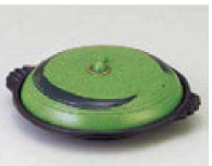
⑲ [AL] ジャンガ陶板 直送 アリン(フッ素加工) H-20-61 27cm ¥14,700 (27φ×8.5) H-20-62 30cm ¥17,800 (30φ×9.5)