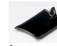
㉓ 1-841-30A 直送 [AL] くわ型陶板(大)(フッ素加工) ¥4,800 (17×22×6)