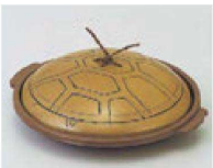
⑱ アルミ陶板焼30cm 直送 亀甲(フッ素加工) 1-841-8 ¥19,500 (30φ×8.5)