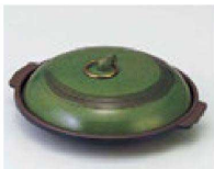
③ アルミ陶板焼 直送 アリンチョコ(フッ素加工) 1-840-4 16cm深型 ¥3,200 (16.5φ×7) 1-840-5 19cm深型 ¥3,500 (19.3φ×7)