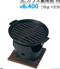
㉘ H-96-24 直送 [AL] グリドル鍋(フッ素2重コート) ¥5,200 (15.5φ×5)(目皿13φ×0.8)(コンロ別売) 強火力対応タイプ