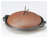
⑧ アルミ陶板焼19cm 直送 煎茶(フッ素加工) H-23-97 浅型 ¥4,000 (19.3φ×7) H-23-98 深型 ¥4,100 (19.3φ×7.5)