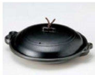
⑦ アルミ陶板焼19cm 直送 黒(フッ素加工) H-23-95 19cm浅型 ¥4,000 (19.3φ×7) H-23-96 19cm深型 ¥4,100 (19.3φ×7.5)