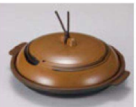
⑤ アルミ陶板焼 直送 春日(フッ素加工) H-96-21 19cm浅型 ¥3,500 (19.3φ×7) H-96-22 19cm深型 ¥3,600 (19.3φ×7.5)