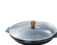
㉒ H-25-45 直送 [AL] ガラス蓋陶板 ミニ ¥6,000 (16.5φ×5.5H) (0.3ℓ)