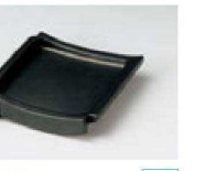
㉒ 1-841-29 直送 [AL] くわ型陶板(小)(フッ素加工) ¥4,100 (13×19×4)