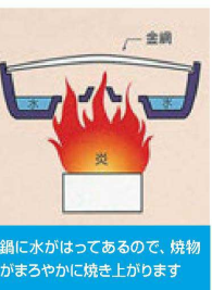
鍋に水がはってあるので、焼物がまろやかに焼き上がります