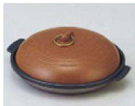
② 1-840-9A 直送 アルミ陶板焼19cm深型 アカネチョコ(フッ素加工) ¥3,600 (19.3φ×7.5)