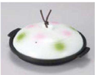
④ アルミ陶板焼 直送 万葉(フッ素加工) H-96-19 16cm深型 ¥3,200 (16.5φ×7) H-96-20 19cm深型 ¥3,500 (19.3φ×7.5)