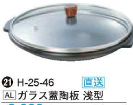
㉑ H-25-46 直送 [AL] ガラス蓋陶板 浅型 ¥6,000 (19φ×6.5H) (0.35ℓ)