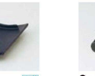
㉑ H-20-60 直送 [AL] 瓦陶板 深型(フッ素加工) ¥5,500 (18×18×3.5)