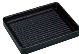
TA ABS長角肉皿 黒 (塗無) エンボス加工