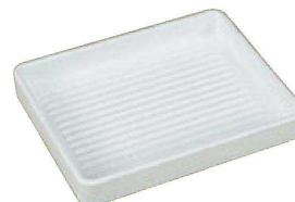
TA ABS長角肉皿 白塗 エンボス加工