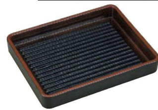
TA ABS長角肉皿 天目 エンボス加工