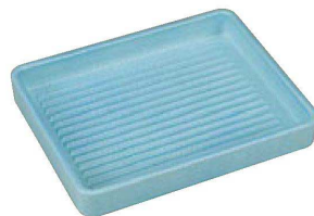
TA ABS長角肉皿 青磁 エンボス加工