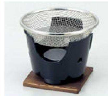
⑩ 1-849-42 受網(ステンレス製) (コンロ・数板別売) ¥900 (14.5φ×3.5)