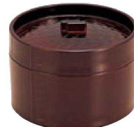
⑭ H-4-40M MT 蒸しセイロ 溜(目皿付) ¥4,100 (13φ×9.2)(目皿PP)