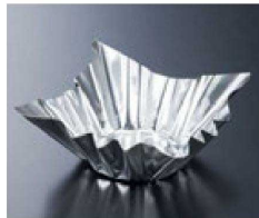
⑦ アルミすき鍋 銀(大) 1-849-27 200枚入 ¥15,000 (24×24) 運賃別途