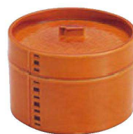
⑫ H-4-42M MT 蒸しセイロ 栃(目皿付) ¥4,100 (13φ×9.2)(目皿PP)