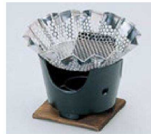
⑨ H-4-45 鍋ホルダー(ステンレス) (コンロ・数板別売) ¥1,400 (17.5φ×4)