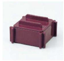
⑯ 1-850-65 P.P ミニセイロ 茶 ¥1,950 (12.2×12.2×7) (内寸9×9×4.5H)