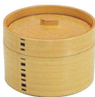
⑪ H-4-41M MT 蒸しセイロ 白木(目皿付) ¥4,400 (13φ×9.2)(目皿PP)

最高グレードのABS樹脂で、通常のABS樹脂と比べて高い耐久性と耐熱性を兼ね備えております。食器洗浄機だけでなく、消毒保管庫にも対応しております。(耐熱温度90℃～110℃)