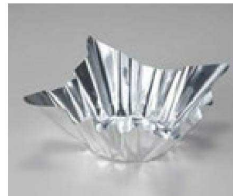
⑥ アルミすき鍋 銀(小) 1-849-25 200枚入 ¥13,000 (18×18) 運賃別途