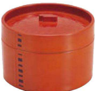
⑬ H-3-64M MT 蒸しセイロ 春慶(目皿付) ¥4,300 (13φ×9.2)(目皿PP)