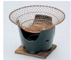
⑪ H-4-44 限定品 銅受網(コンロ・数板別売) ¥1,000 (18φ×3.5)