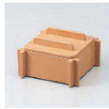
⑮ 1-850-66 P.P ミニセイロ クリーム ¥1,950 (12.2×12.2×7) (内寸9×9×4.5H)