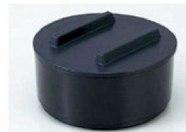
⑰ P.P 蒸しセイロ 1-850-63A 黒素地 本体 ¥1,900 (15φ×8)