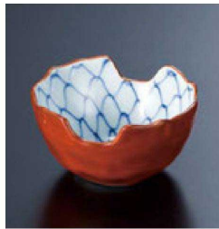
① H-96-43 直送 陶箸置珍味 朱塗内アミ(有田焼) ¥2,000 (6.5φ×3.8)