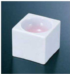
④ H-12-31 直送 陶角丸珍味 白磁ピンク吹(有田焼) ¥1,900 (4.9×4.9×4.3)