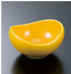
⑧ H-70-17 直送 陶丸舟型小付 黄釉(有田焼) ¥3,700 (7×6.5×3.8)