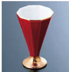
⑥ H-62-60 直送 陶十角食前酒 赤釉高台金彩(有田焼) ¥2,150 (5.5×5.7×8.9)