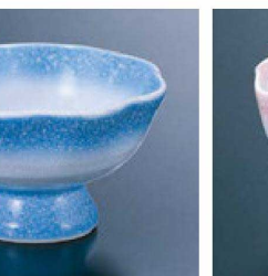
⑲ H-11-93 直送 陶なぶり高台小鉢 ピンクたたき(有田焼) ¥2,900 (11.2φ×7.2)