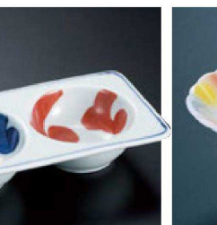
㉓ H-11-90 直送 陶花淵高台小鉢 三色たたき(有田焼) ¥2,900 (14φ×5.4)

直送 この頁の商品はメーカーから直送の為、運賃は別途請求になります。 *この頁の商品は、掛率が異なりますのでご注意ください。