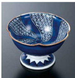
⑬ H-70-27 直送 陶高台小付 Y地紋(有田焼) ¥7,200 (9.5φ×5.8)