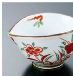
⑯ H-70-9 直送 陶二方ナブリ中付 錦花万歴(有田焼) ¥2,000 (10.7×8.1×5.6)