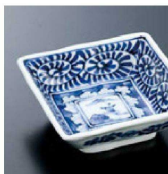
⑳ H-70-8 直送 陶変形角皿(小) 山水唐草(有田焼) ¥1,250 (9.5×9.5×3.5)