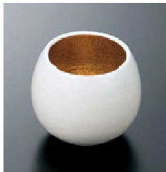
⑦ H-70-21 直送 陶しづく小付 白M吹内金塗(有田焼) ¥3,300 (6.5φ×6)