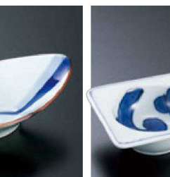
㉒ H-93-92 直送 陶唐草濃丸二品盛(有田焼) ¥2,100 (14×7.6×2.6)