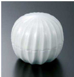
⑨ H-70-20 直送 陶手まり型珍味 アイボリー(有田焼) ¥1,900 (7.5φ×6.5)