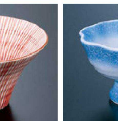
⑱ H-11-91 直送 陶なぶり中付 ブルーたたき(有田焼) ¥2,700 (10.8φ×6.5)