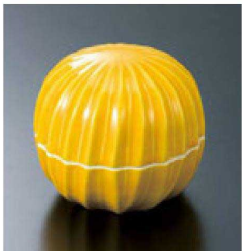
⑩ H-70-19 直送 陶手まり型珍味 黄釉(有田焼) ¥1,900 (7.5φ×6.5)