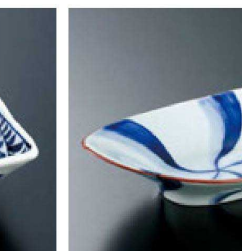
㉑ H-70-18 直送 陶楕円一品盛 内外流水(有田焼) ¥1,400 (12.2×7.1×3.2)