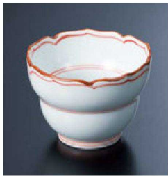
③ H-96-44 直送 陶ひさご型小付 測サビ見込筋(有田焼) ¥1,300 (6.7φ×5)