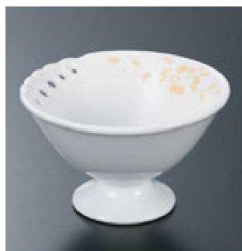
⑫ H-70-26 直送 陶馬上中付 一珍ページュばら透かし(有田焼) ¥4,400 (9φ×5.5)