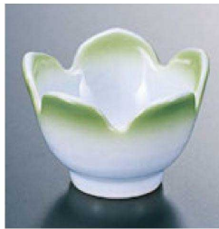
② H-12-23 直送 陶桔梗珍味 ヒワ吹(有田焼) ¥1,450 (6.4φ×4.3)