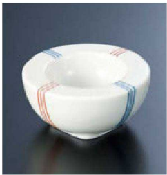
⑤ H-96-45 直送 陶丸々小付 二色線(有田焼) ¥1,600 (7φ×3.5)