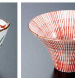
⑰ H-70-13 直送 陶反鉢 内外刷毛十草(赤)(有田焼) ¥1,900 (12.1φ×7.1)