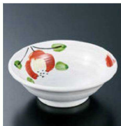
⑪ H-70-16 直送 陶反丸千代口 粉引椿(有田焼) ¥1,350 (8.6φ×3)