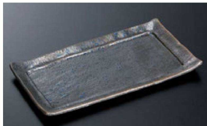
⑯ H-93-96 直送 陶黒吹陶長角皿 (有田焼) ¥1,450 (22.5×12×1)