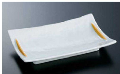
⑭ 陶布目長角小焼皿 錦古代釉金測 (有田焼) H-70-43 ¥5,900 (17.8×10.9×3) 直送