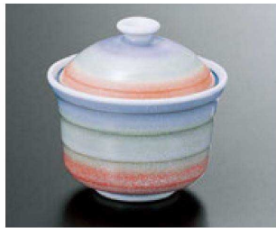
① H-11-83 直送 陶小蓋物 二色たたき (有田焼) ¥3,700 (9.4φ×9.2)