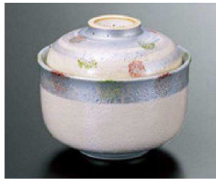
② H-11-84 直送 陶ゆず肌蓋物(小) 雲母銀彩 (有田焼) ¥4,700 (10.6φ×9)