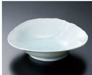
⑩ H-93-89 直送 陶青白磁切継小鉢 (有田焼) ¥3,500 (15.5×14×4.2)