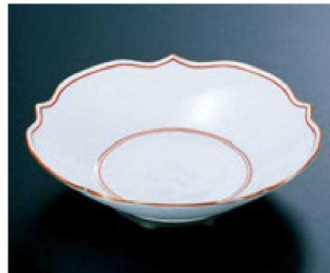
⑪ H-12-13 直送 陶花型深皿 赤線見返筋入 (有田焼) ¥1,700 (16.5φ×4)