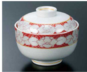
③ H-70-6 直送 陶U型煮物碗(大) ローズ赤ラスター (有田焼) ¥9,400 (11.8φ×10.2)