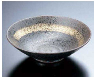
⑥ H-20-64 直送 陶金彩小鉢 (有田焼) ¥1,300 (13.2×13.2×4)