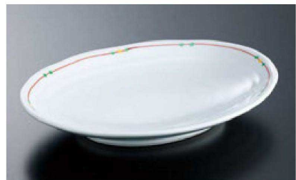
⑮ 陶ひねり千段精円取皿 錦点紋 (有田焼) H-70-39 ¥2,200 (18×13×3) 直送