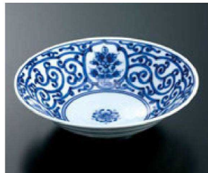
⑦ H-70-28 直送 陶特小鉢 間取青花紋 (有田焼) ¥1,600 (15.3φ×4)