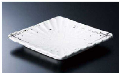
⑬ 陶菱形焼物皿 白吹菊 (有田焼) H-96-47 ¥4,400 (22.2×16.5×2.4) 直送