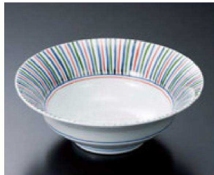
⑨ H-93-95 直送 陶三色十草瀏友鉢 (有田焼) ¥2,300 (15.5φ×5.4)