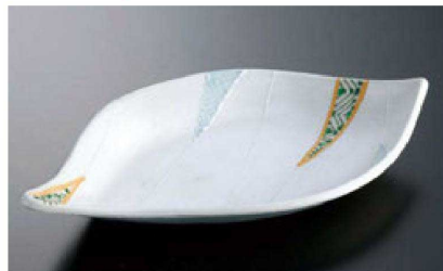
⑰ H-70-48 直送 陶葉型ベタ焼皿 ホワイト銀彩二色三角紋 (有田焼) ¥5,200 (24×14.8×4)

直送 この頁の商品はメーカーから直送の為、運賃は別途請求になります。 *この頁の商品は、掛率が異なりますのでご注意ください。