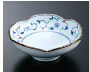
⑧ H-70-29 直送 陶花型多用鉢 染錦唐草 (有田焼) ¥2,900 (15φ×5.7)