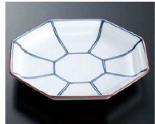
⑫ H-70-40 直送 陶6寸角皿 間取 (有田焼) ¥2,700 (18.5×17.5×2.8)