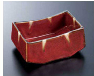
④ H-70-37 直送 陶箱舟小鉢 南天赤流し (有田焼) ¥5,850 (13×9×5.5)