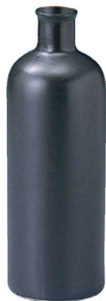
30 H-10-61 陶 焼酎ポトル 限定品 ¥1,500 (8.3φ×24.5)