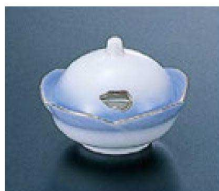
17 H-11-43 陶 華珍味 (蓋付) 淡青ほかし天金 限定品 ¥650 (7.3×7.1×5.5) 幅100