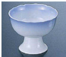
23 H-11-52 陶 高台珍味 (小) 淡青ほかし 限定品 ¥600 (8.3φ×6.6) 幅80