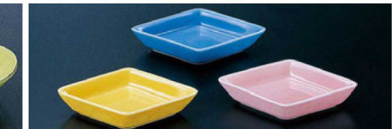
26 H-11-25 陶 低菱形珍味 黄 限定品 ¥450 (14.5×8.5×2.8) 幅80 27 H-11-26 陶 低菱形珍味トルコ 限定品 ¥450 (14.5×8.5×2.8) 幅80 28 H-11-27 陶 低菱形珍味ピンク 限定品 ¥450 (14.5×8.5×2.8) 幅80