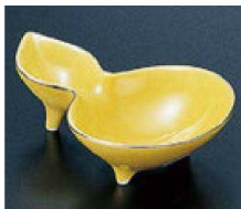
24 H-11-46 陶 ひさご珍味 黄天金 限定品 ¥550 (11.8×8.2×3.5) 幅80