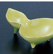
25 H-11-47 陶 ひさご珍味 ヒワグリーン天金 限定品 ¥550 (11.8×8.2×3.5) 幅80