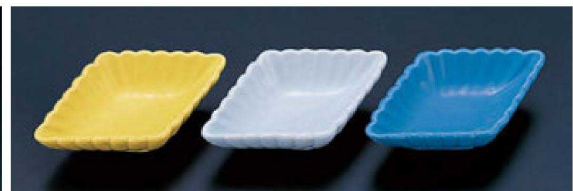
20 1-337-35 陶 菱形陶器 黄 限定品 ¥270 (10.8×6.8×2.9) 幅100 21 1-337-37 陶 菱形陶器 青磁 限定品 ¥270 (10.8×6.8×2.9) 幅100 22 1-337-38 陶 菱形陶器 トルコ 限定品 ¥270 (10.8×6.8×2.9) 幅100