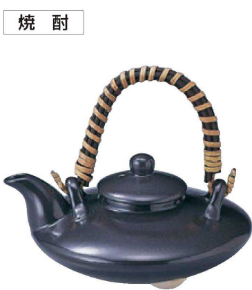
29 H-10-60 陶 千代香 黒つやなし 限定品 ¥1,900 (15.2φ×17×9)