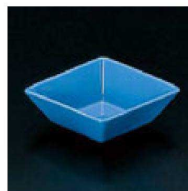
19 H-11-23 陶 高菱形珍味トルコ 限定品 ¥250 (11×7.3×3.5) 幅100