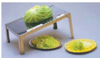
⑫ ハンドスライサー KB-727 H-26-1 ¥41,000 (20×35×18)