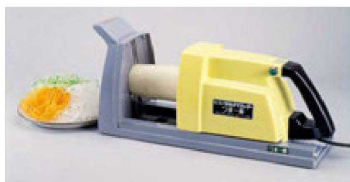
⑩ スーパーツインつま一番 HS-010 H-25-98 ¥257,000 (16×47×22)