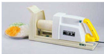
⑪ 電動つま一番 HS-112 H-25-99 ¥206,900 (16×47×22)