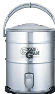
⑤ H-19-92 大型ステンレスキーパー(12ℓ) ¥21,000 (31.5 × 33 × 40.4) 幅4