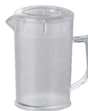
⑦ R-10-41 限定品 [PC]ピッチャー 1ℓ ¥1,700 (16.3×19 内寸10.7φ) 幅30