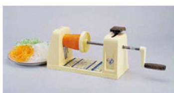
⑨ プラスチックつま一番 HS-313 1-959-3 ¥38,800 (13×41×18)