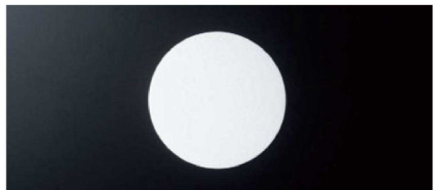
⑥ 丸コースター (100枚入) H-17-84 白無地 (9φ) ¥810 (1枚¥8.1) H-17-85 白無地(厚口) (9φ) ¥1,580 (1枚¥15.8)