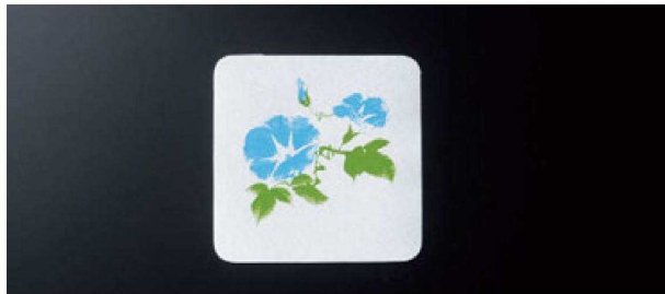
① 角コースター朝顔(100枚入) H-70-62 (9×9) ¥1,260 (1枚¥12.6)