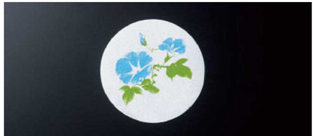
② 丸コースター朝顔(100枚入) H-70-63 (9φ) ¥1,260 (1枚¥12.6)