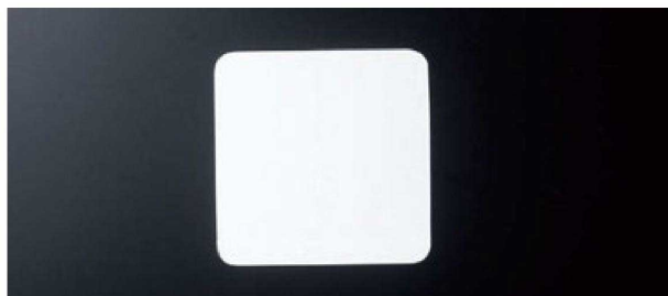
⑤ 角コースター (100枚入) H-17-82 白無地 (9×9) ¥810 (1枚¥8.1) H-17-83 白無地(厚口) (9×9) ¥1,580 (1枚¥15.8)