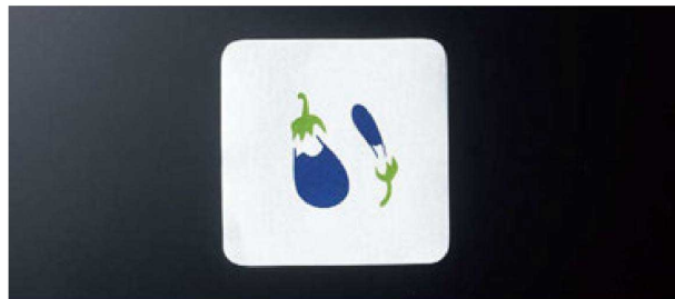
③ 角コースターなすび(100枚入) H-70-64 (9×9) ¥1,260 (1枚¥12.6)