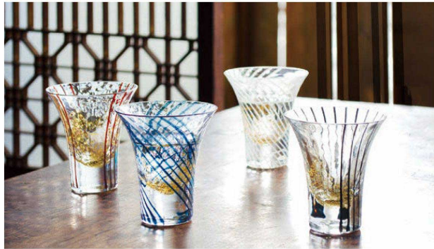
四季折々の江戸の風情を器に表現しました。

この製品は職人が細い色ガラス棒と金箔をガラスに巻き取り、ひとつひとつを丹精込めて作り上げています。