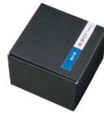
専用化粧箱 (10783杯涼み酒)