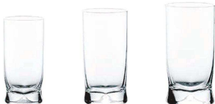
08406HS タンブラー ¥670 (税込¥737) 120コ入(6×20) φ55×H110・M55 180ml 49 06678 459118