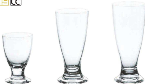
35102HS ミニビルスナー ¥690 (税込¥759) 60コ入(6×10) φ66×H102・M66 135ml 49 06678 322832