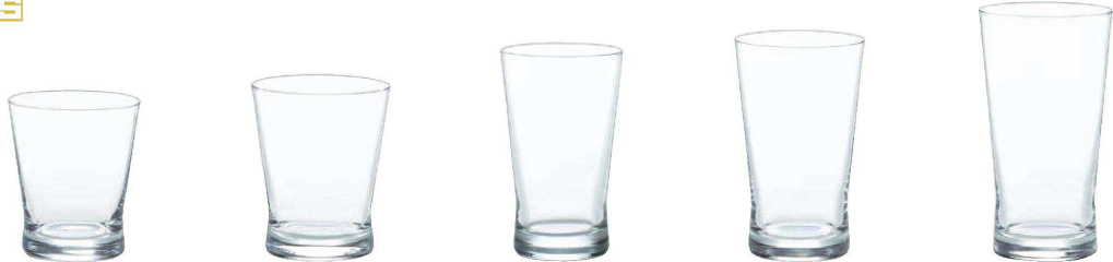
T-22104HS 9オンスタンブラー ¥670 (税込¥737) 60コ入(6×10) φ82×H95・M82 275ml 49 06678 126331 グッドデザイン賞