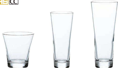
B-27104HS フリーグラス ¥610 (税込¥671) 72コ入(6×12) φ82×H86・M82 210ml 49 06678 146339 グッドデザイン賞