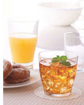
B-42101HS 12タンブラー ¥590 (税込¥649) 72コ入(6×12) φ82×H115・M82 370ml 49 06678 159193 グッドデザイン賞