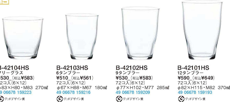
B-42104HS フリーグラス ¥530 (税込¥583) 72コ入(6×12) φ83×H80・M83 270ml 49 06678 159223 グッドデザイン賞