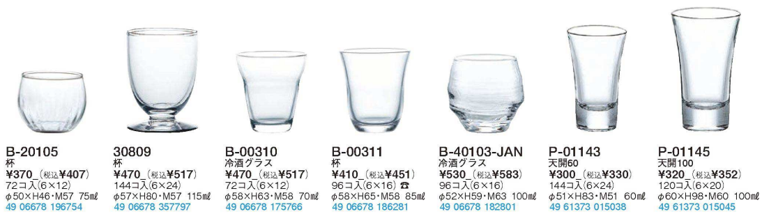
B-20105 杯 ¥370 (税込¥407) 72コ入(6×12) φ50×H46・M57 75ml 49 06678 196754