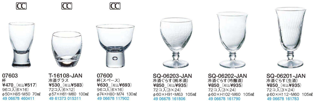
07603 杯 ¥470 (税込¥517) 96コ入(6×16) φ50×H85・M50 70ml 49 06678 460411