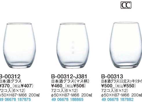
B-00312 日本酒グラス ¥370 (税込¥407) 72コ入(6×12) φ50×H87・M66 200ml 49 06678 187875