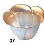
ワンウェイ・プラ小鉢 梅 (200個入) 07 (27805) 金 7,500円 (1ヶ当り37.5円) ※材質: 耐熱HIPS ※耐熱温度 +80~-20℃ 08 (27806) 黒 4,700円 (1ヶ当り23.5円) ※材質: HIPS ※耐熱温度 +60~0℃ 09 (27807) クリア 4,700円 (1ヶ当り23.5円) ※材質: PET ※耐熱温度 +80~-5℃ 約φ5×H2.8cm ※色によって素材が違い、耐熱温度が異なります。