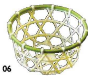
樹脂豆籠 緑 (50ヶ入) 06 (26678) 4,900円 (1ヶ当り98円) 約φ6×H3cm ※材質: プラスチック