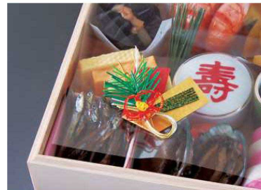
05,06はお節重にも最適です。 05：お節重6.5寸に適合 06：お節重7寸に適合