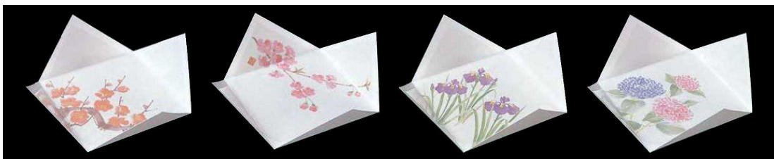
01 (65590) うめ(1月~3月) 02 (65591) さくら(3月~4月) 03 (65592) あやめ(4月~5月) 04 (65593) あじさい(6月~7月)