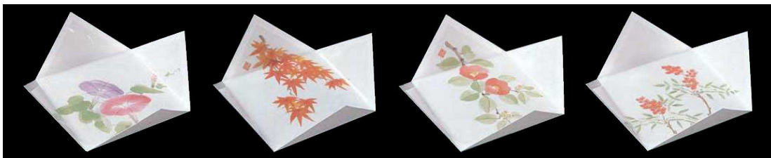
05 (65594) あさがお(7月~8月) 06 (65595) もみじ(9月~11月) 07 (65596) つばき(11月~2月) 08 (65597) なんてん(12月~1月)