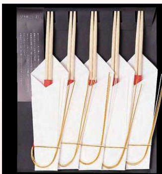
麗 白 5膳入 05 (64626) 1,650円 ※箸材質:柳