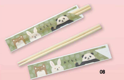
子供箸(アスペン・袋入)(50膳入) 08 (15539) 1,350円 箸約L18cm (1膳当り27円) ※丸箸タイプ