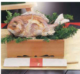
宴 寿(桃) 5膳入 02 (64811) 830円 ※無蛍光雲電和紙使用 ※箸材質:柳