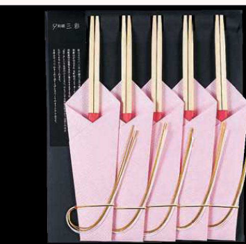
麗 桃 5膳入 06 (64625) 1,650円 ※箸材質:柳