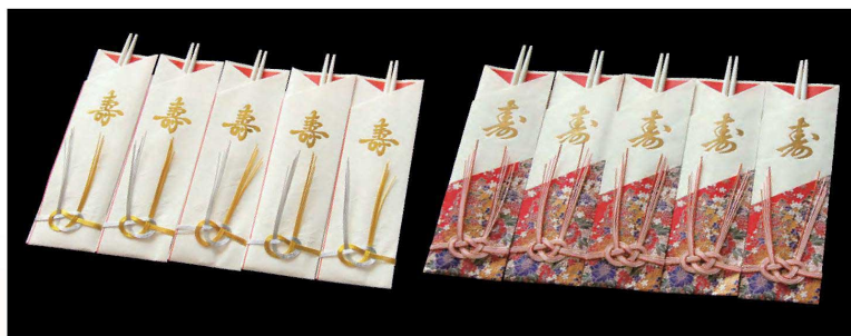
金寿 5膳入 03 (26023) 480円 ※箸材質:アスペン