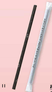
匠の紙ストロー (10本入) 11 (78268) 280円 約φ0.5×L19.7cm (1本当り28円)