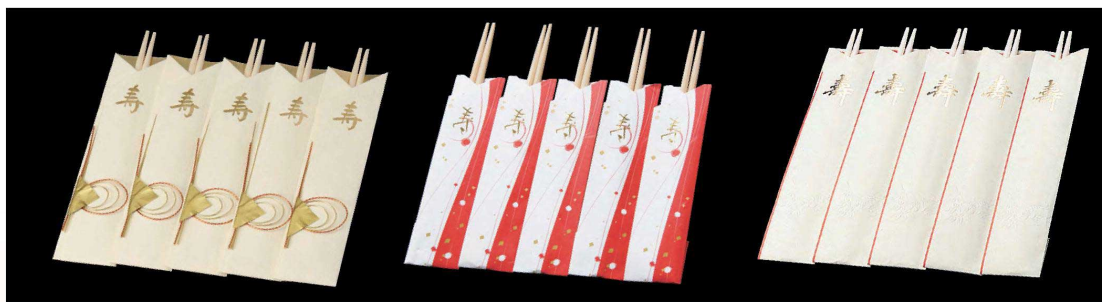
日の出 5膳入 03 (63937) 740円 ※箸材質：アスペン