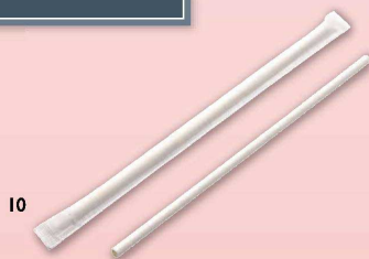
紙のストロー 白 (完封) (200本入) 10 (08881) 2,200円 約φ0.6×L21cm (1本当り11円)