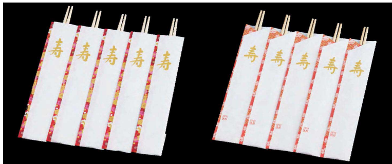
錦紅梅 5膳入 01 (63946) 360円 ※箸材質：柳