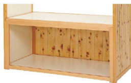
ユニットショップの裏側