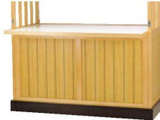
キャスター付台輪使用例