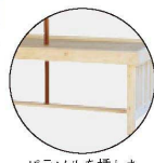
パラソルを挿した イメージ