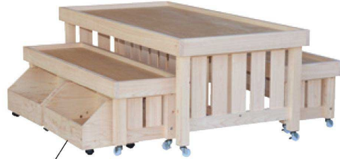
平台にストッカーをつけることが可能!