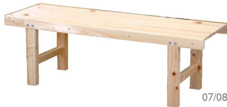
07/08/09 ひのき ウッドベンチ (無塗装) 組立 07 (51423) W90 約90×40×H40cm 19,000円 08 (51424) W120 約120×40×H40cm 23,000円 09 (51425) W150 約150×40×H40cm 29,000円