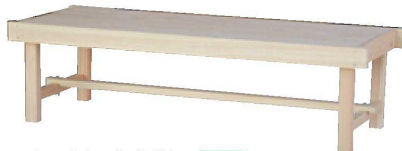
05 ひのき・床机 (無塗装) 組立 05 (52030) 約150×60×H40cm 64,000円