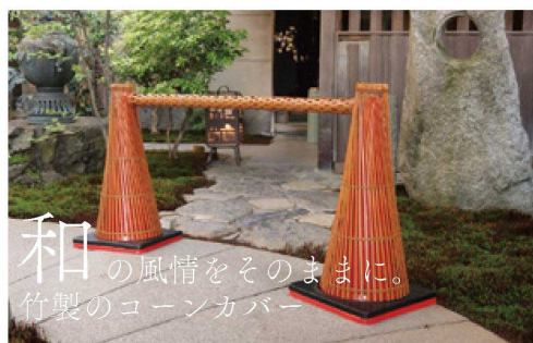
天然竹・和風ロードコーンカバー L 14 (52036) 15,000円 約φ6×L166cm フック真鍮製・たこ紐 水性木材保護塗料仕上げ