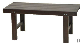
10/11/12 ひのき ウッドベンチ (古代色) 組立 10 (51427) W90 約90×40×H40cm 32,000円 11 (51428) W120 約120×40×H40cm 34,000円 12 (51429) W150 約150×40×H40cm 45,000円