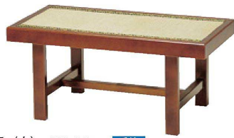
01 待合椅子 (中) <UC-90> 受注 01 (57207) 約90×45×H40cm 75,000円