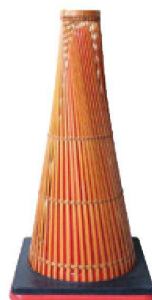
天然竹・和風ロードコーン用カバー 13 (52035) 11,300円 約φ31×H70cm 市販コーン/重石H70cmタイプをご使用ください。 水性保護塗料仕上げ