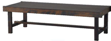
06 ひのき・床机 (古代色) 組立 06 (52031) 約150×60×H40cm 83,000円