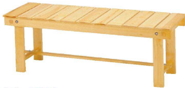
03 白木縁台 組立 03 (56233) 約120×40×H41cm 35,500円