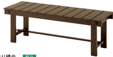
04 黒塗り縁台 組立 04 (57214) 約120×40×H41cm 39,500円