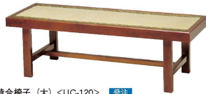
02 待合椅子 (大) <UC-120> 受注 02 (57206) 約128×45×H40cm 88,000円