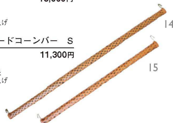
天然竹・和風ロードコーンカバー S 15 (52037) 11,300円 約φ6×L116cm フック真鍮製・たこ紐 水性木材保護塗料仕上げ