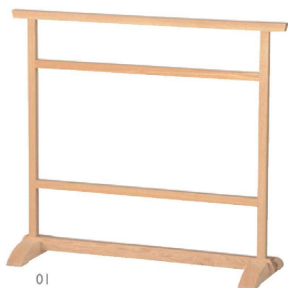
01 WM バスタオル掛け 01 (52050) クリアー 60,000円 約85×30×H75cm