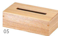
05 WM ティッシュボックス 05 (50601) クリアー 6,500円 約25.4×14×8.5cm