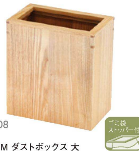
08 WM ダストボックス 大 08 (50613) クリアー 10,800円 約25×15×H27.5cm