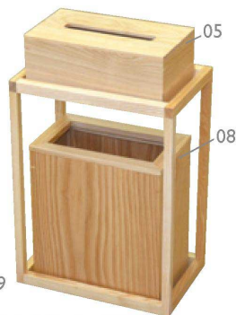
09 WM エチケットスタンド 09 (50280) クリアー 14,500円 約30×19×H40.5cm ※ティッシュボックス・ダストボックス(大)は別売です。 (別売) 50601 WMティッシュボックス/クリアー 50613 WMダストボックススリム/クリアー