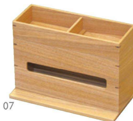
07 WM アメニティボックス付ティッシュボックス 07 (50285) クリアー 14,000円 約25×12×H18.2cm ティッシュボックス/約25×12×H14cm アメニティボックス/約25×9×H4.2cm ※ティッシュボックスは上部開口です。 ※アメニティボックスは可動仕切り板1枚付