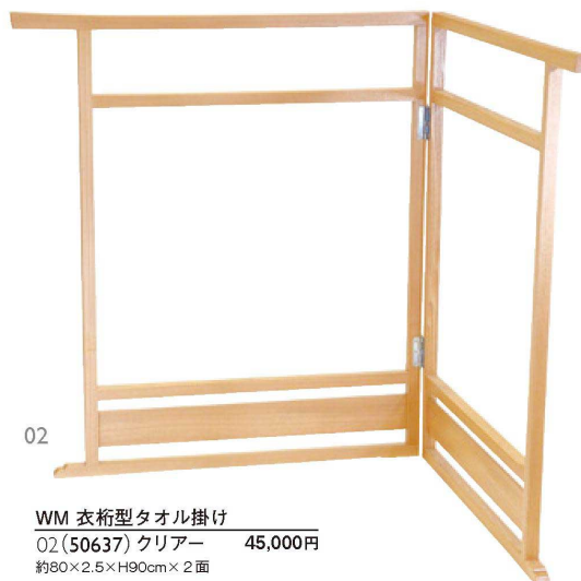
02 WM 衣桁型タオル掛け 02 (50637) クリアー 45,000円 約80×2.5×H90cm×2面