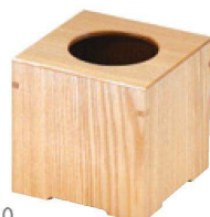
10 WM ダストボックス 小 10 (50607) クリアー 7,200円 約15×15×H15cm