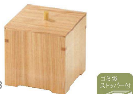
03 WM サニタリーボックス 03 (50616) クリアー 7,800円 約13×13×H14.5cm