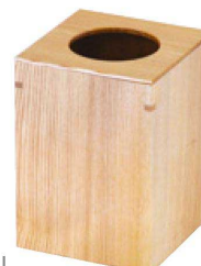
11 WM ダストボックス 中 11 (50610) クリアー 8,200円 約15×15×H21cm