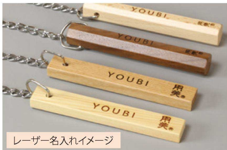
レーザー名入れイメージ

ロゴやお部屋番号などを レーザー刻印にて名入れ可能です。 別注で、オリジナル形状も承ります。 ※別途見積