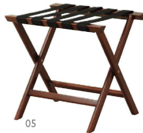
バゲージラック 05 (50239) ラバーウッド 31,000円 約47×41×H45.5cm ※フレーム：ラバーウッド ベルト：ナイロン (ブラック)