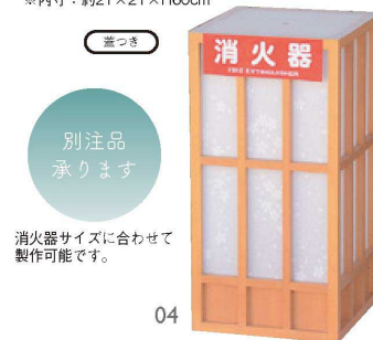
消火器カバー 蓋つき 見積 受注 04 (52097) 約30×30×H60cm ※内寸：約26×26×H60cm