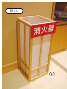
消火器カバー 受注 見積 03 (51487) 約25×25×H60cm ※内寸：約21×21×H60cm