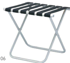
バゲージラック 06 (50238) アルミ 19,000円 約47×41×H41cm ※フレーム：アルミ (φ1.9cm) アルマイト仕上 ベルト：ナイロン (ブラック)