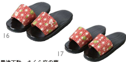
黒塗下駄 さくら麻の葉 16 (50028) 男性用 約25.5×10cm 6,100円 17 (50029) 女性用 約24.8×9cm 6,100円 ※底面クッション材付