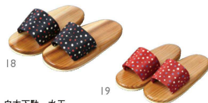
白木下駄 水玉 18 (50030) 男性用 約25.5×10cm 6,100円 19 (50031) 女性用 約24.8×9cm 6,100円 ※底面クッション材付