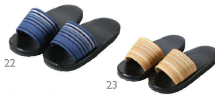
黒塗下駄 縞 22 (50036) 男性用 約25.5×10cm 6,100円 23 (50037) 女性用 約24.8×9cm 6,100円 ※底面クッション材付