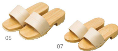
サンダル ナチュラル・ベージュ 06 (60192) 大 約25×8cm 3,300円 07 (60193) 小 約23.5×7.5cm 3,300円