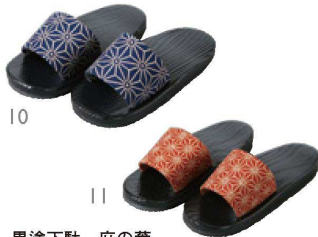
黒塗下駄 麻の葉 10 (50024) 男性用 約25.5×10cm 6,100円 11 (50025) 女性用 約24.8×9cm 6,100円 ※底面クッション材付