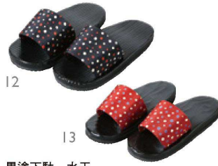
黒塗下駄 水玉 12 (50032) 男性用 約25.5×10cm 6,100円 13 (50033) 女性用 約24.8×9cm 6,100円 ※底面クッション材付