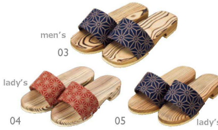
焼杉サンダル 麻の葉 03 (50020) 男性用 約25×8cm 3,200円 04 (50021) 女性用 朱 約23.5×7.5cm 3,200円 05 (60185) 女性用 紺 約23.5×7.5cm 3,200円 ※底面クッション材付