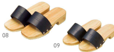
サンダル ナチュラル・黒 08 (60194) 大 約25×8cm 3,300円 09 (60195) 小 約23.5×7.5cm 3,300円