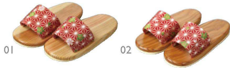
白木下駄 さくら麻の葉 01 (50026) 男性用 約25.5×10cm 6,000円 02 (50027) 女性用 約24.8×9cm 6,000円 ※底面クッション材付