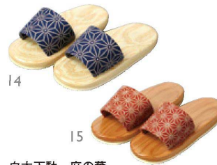
白木下駄 麻の葉 14 (50022) 男性用 約25.5×10cm 6,100円 15 (50023) 女性用 約24.8×9cm 6,100円 ※底面クッション材付