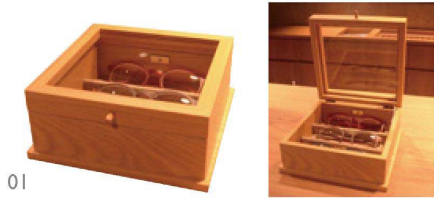
01 老眼鏡入 受注 01(51488) 約22×22×H7cm 24,000円 ※材質:アッシュ材/着色仕上げ 内部:ハイミロン張 ※ケヤキ色