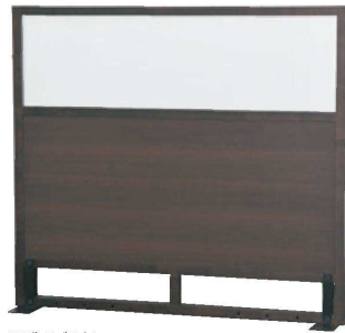
01/02 ※画像はブラウン ホールパーティション (脚可動式) W150cmタイプ 01 (57167) クリアー 受注 組立 運賃 130,000円 02 (57168) ブラウン 受注 組立 運賃 130,000円 約150×30×H135cm 上部：樹脂ガラス (マット)