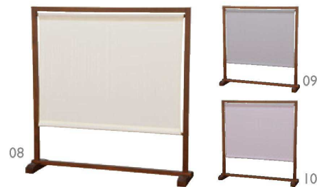
抗ウイルスパーティションS 木部塗装色/ブラウン 08 (57264) 布/アイボリー 受注 運賃 71,000円 09 (57265) 布/ダークグレー 受注 運賃 71,000円 10 (57266) 布/ライラック 受注 運賃 71,000円 約135×33×H135cm ※生地：綿100% ※木部は加工してありません。