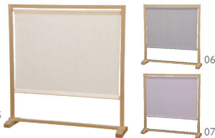
抗ウイルスパーティションS 木部塗装色/ナチュラル 05 (57261) 布/アイボリー 受注 運賃 71,000円 06 (57262) 布/ダークグレー 受注 運賃 71,000円 07 (57263) 布/ライラック 受注 運賃 71,000円 約135×33×H135cm ※生地：綿100% ※木部は加工してありません。