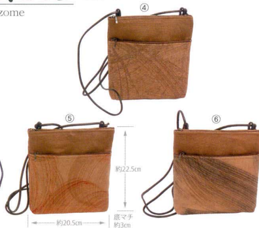
柿渋染 手描き2Fポシェット 2,000円(税抜) (KS-111)

①865574 柿渋柄 ②850570 墨柄 ③850587 弁柄 約15×H18×底マチ2cm・(ショルダー)約120cm/重さ約45g/ファスナー開閉 材質:(本体)綿・(ショルダー)アクリル編引き・(付属パーツ)天然木